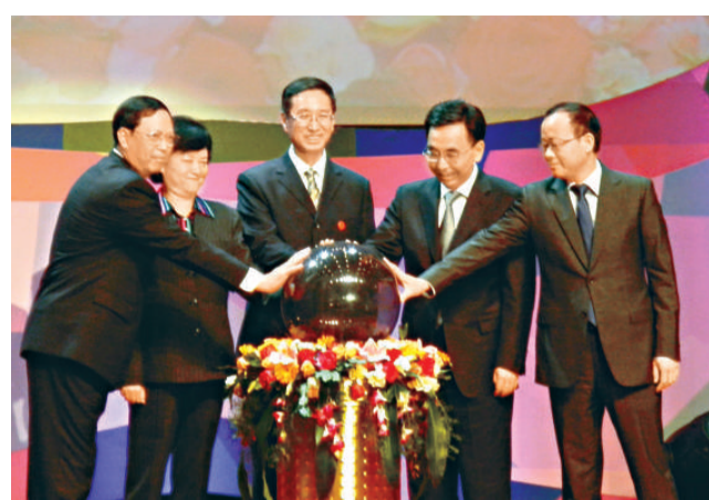
儀式 ▲嘉賓為紀錄片大會主持啓動