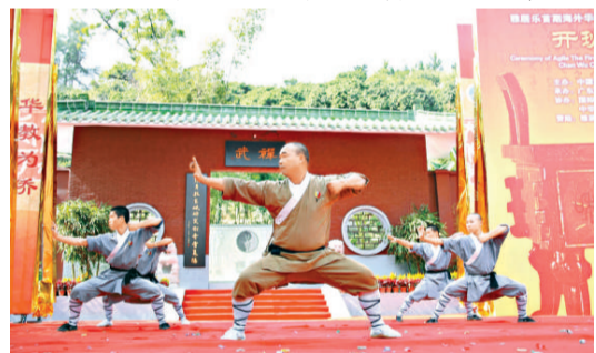
▲禪武中心學員表演傳統功夫（本報攝）

廣東省僑辦主任吳銳成表示，近幾年，隨着海外僑胞傳承文化需求的日益增長，省僑辦要求學校逐步轉型，加大「文化為僑」的力度。今年五月，省僑辦又大力推動學校與國際禪武聯盟合作創新中華文化傳承基地禪武中心，更好地發揮學校支持海外傳承中華文化的功能。繼今年五月舉辦海外華裔青年禪武文化體驗班之後，現在又在此舉辦「海外華裔青年禪武文化專修班」。