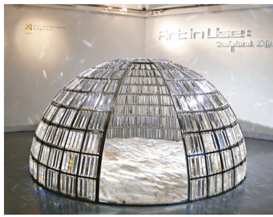
▲張曉剛銅鑄作品《鋼筆二號》反映藝術家遭受苦難的童年