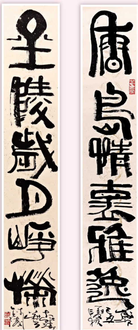
岑文濤書法對聯 (右) 香島情懷雅逸 230cm X 40cm (左) 金陵歲月嶙峋 230cm X 40cm

吾兄岑文濤，近來展事連年，並穿梭於祖國的大江南北。適才「躍馬香江」，昨又「青島揚帆」，今更「金陵渡墨」。我謂：優秀書畫家，是必定要跟着自己作品走的。信乎？ 我與文濤兄相知相交近四十年，每為其樂天奔放的性格所感染而快樂非常。早年，我常為他的書法，尤其是他的「大榜」，又為他的詩詞歌賦賦修養所嘆服。近十年來又為他的畫作而深感驚訝！ 岑兄作畫，與我這等「畫奴」、「畫匠」不同，他絕不會為「形」所役，一味的肆意縱橫奔走如龍！其所畫者，正如齊白石所說的「此乃活本所無」者。他從不對自然狀物描摹，他熱衷表現的只是一種令他如癡如醉的酣暢，一種不斷幻變着的意境。 觀岑兄作畫，頗感醉人。他既氣定神閑又旁若無人。潑墨噴彩，率性縱橫，真有白少先生所云：「無我無人無古今，天機何處不堪尋」，盡顯出一番名士的風采！我想這便是「腹有詩書氣自華」的明證吧！ 陳永鏘 中國美術家協會理事 廣東美術家協會副主席 嶺南畫派紀念館館長