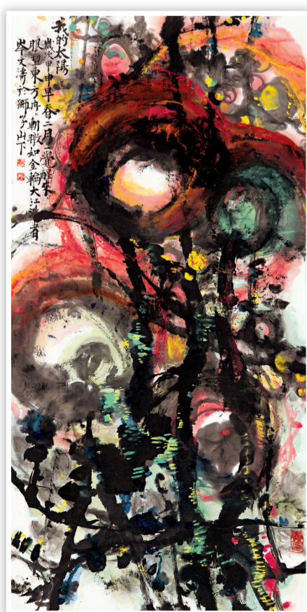
▲我的太陽 136cm X 70cm