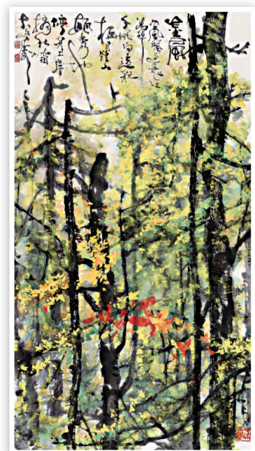
►金風 136cm X 70cm

其中有岑先生為是次展覽最新力作組畫「大地和諧」之春夏秋冬及720cm X 100cm草書長卷「新程頌歌」。 集詩詞楹聯書法繪畫於一身 岑先生乃集詩詞、楹聯、書法、繪畫於一身的創作型藝術家；也是一位中華民族文化藝術的堅定守護者。他的繪畫，中西合璧，一爐共冶，筆墨縱橫，色彩斑斕，形飄物外，神擊毫端；他的書法，有章有矩，有法有度，古今融匯，着力創新，篆隸楷行草，各具面目，自成風格。 岑文濤的書畫作品充滿陽光、生命；積極向上，隨緣和諧。相信岑先生是此次南京書畫之旅，會將香港人的獅子山下精神帶往金陵。