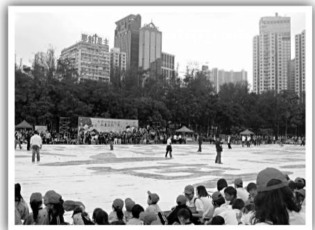
▲「世界紀錄齊創造，向毒品說：不！」大型畫布終於大功告成了！