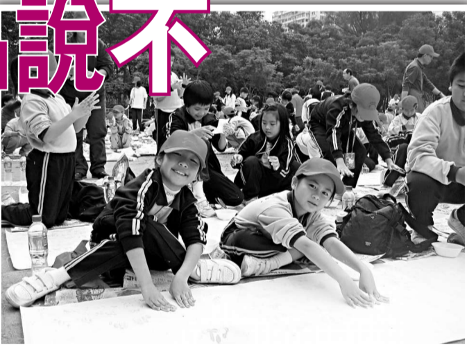
▲鴨脷洲街坊學校老師和同學以手指沾上顏料，印在布上宣誓，表示會堅拒毒品的引誘，會向毒品說：「不！」

5A李翠珊同學表示，她是第一次參與禁毒活動，覺得十分有意義。令她印象最深刻的是香港行政長官曾蔭權，率領三千多位的學生宣讀禁毒口號，在完成宣讀禁毒口號一刻，全場同學向天拋起由大會提供的紅色帽子，帽子上印有「向毒品說：不！」的口號。