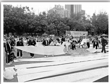
▲同學同心協力，將鴨脷洲街坊學校完成的畫布，與其他學校同學所完成的畫布拼合起來