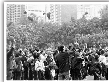
▲當香港行政長官曾蔭權率領同學宣讀禁毒口號後，大家即時拋起印有「向毒品說：不！」的紅色帽子，寓意遠離毒品的決心