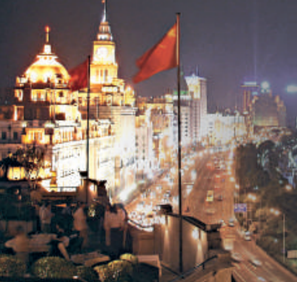
樓高七層的外灘三號坐享上海灘的全景

美國財經雜誌《福布斯》選出全球十一種最奢侈的餐點，其中，上海的「外灘三號」的餐點排第十一位。