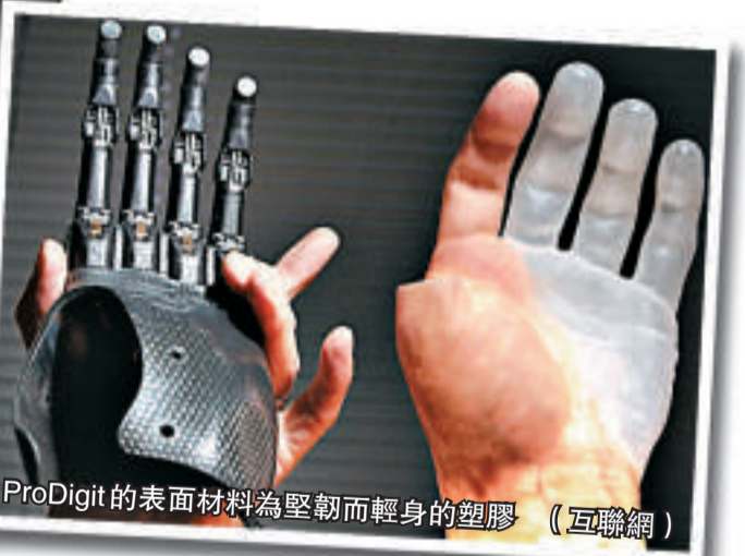
ProDigit的表面材料為堅韌而輕身的塑膠 (互聯網)

目前，全球約有一百二十萬人 (包括逾五萬名歐洲人) 手指不齊全，其中一部分是由天生缺陷所致。(英國《每日郵報》)