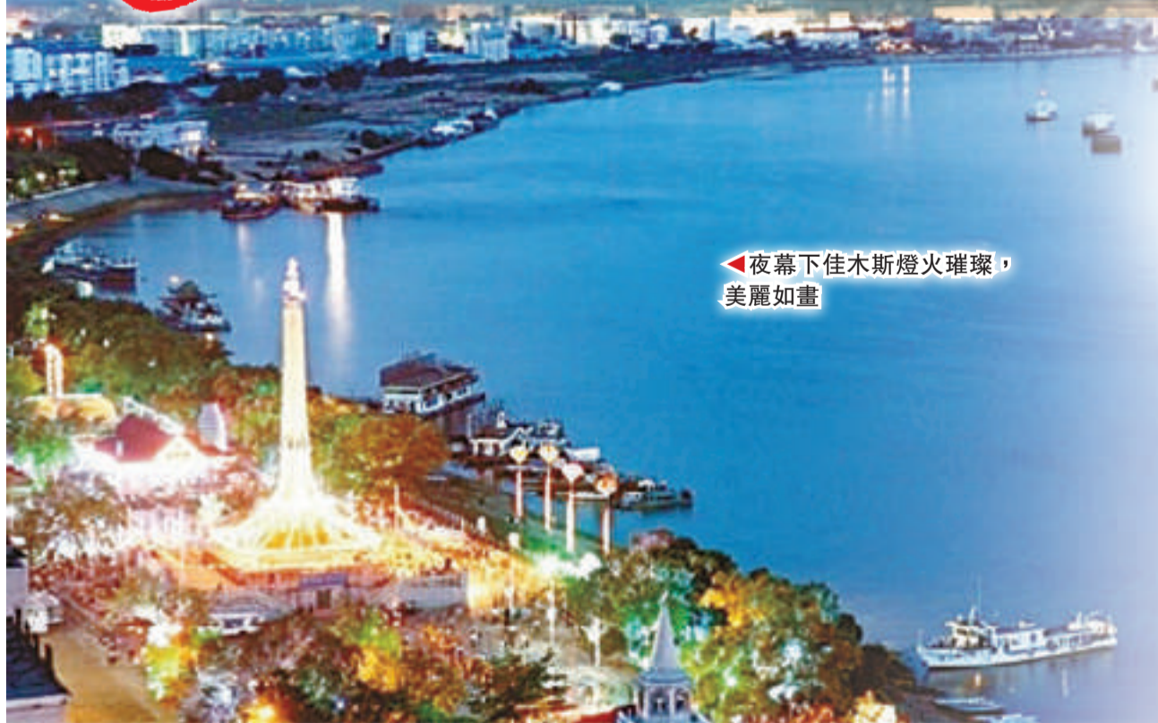
◀夜幕下佳木斯燈火璀璨，美麗如畫

佳木斯坐落在世界三大黑土地之一的三江平原腹地，是祖國最早迎接太陽升起的地方，被譽為「華夏東極」。國境線總長448公里，北隔黑龍江、東隔烏蘇里江分別與俄羅斯比羅比魯斯市和哈巴羅夫斯克市相望，是對俄開放的「集散地」和連接歐亞的「大陸橋」。