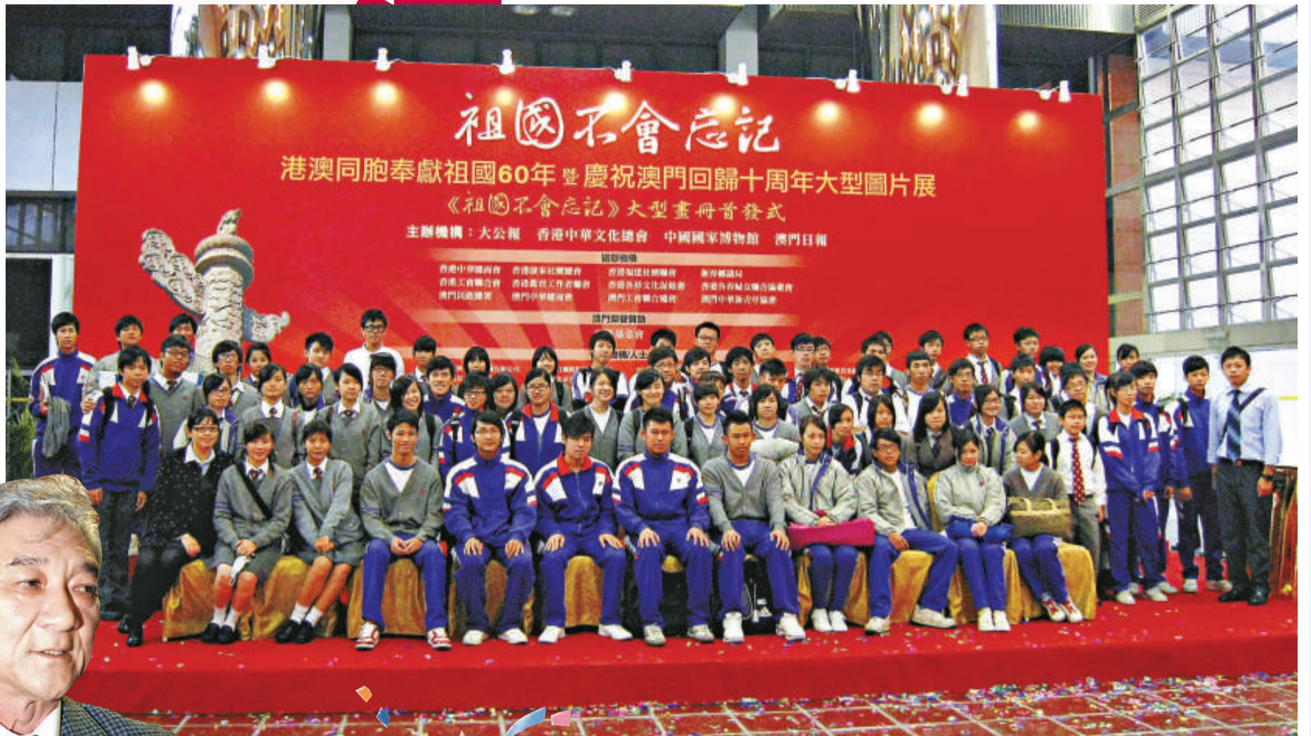
▲澳門培華中學組織學生參觀圖片展

時間：2009年10月21日~10月26日 地點：中華世紀壇 展覽亮點： 首次在北京舉辦的全面、系統反映港澳同胞六十年來對祖國貢獻的圖片展； 中共中央政治局委員、國務委員劉延東，全國