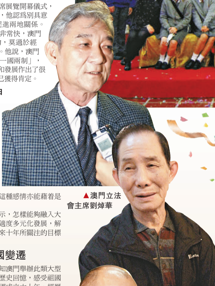
▲澳門立法會主席劉焯華