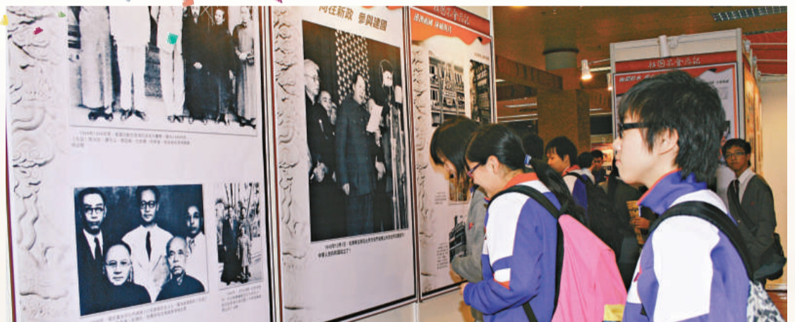
◀學生細閱展版內容