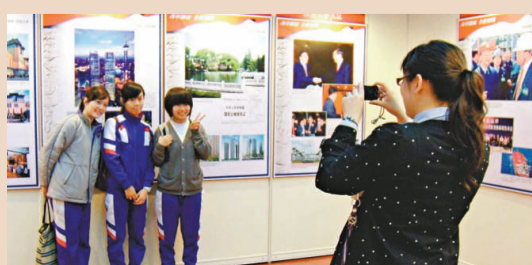
▲林老師（右一）除了為學生現場解說，還為學生拍照留下有意義的一刻