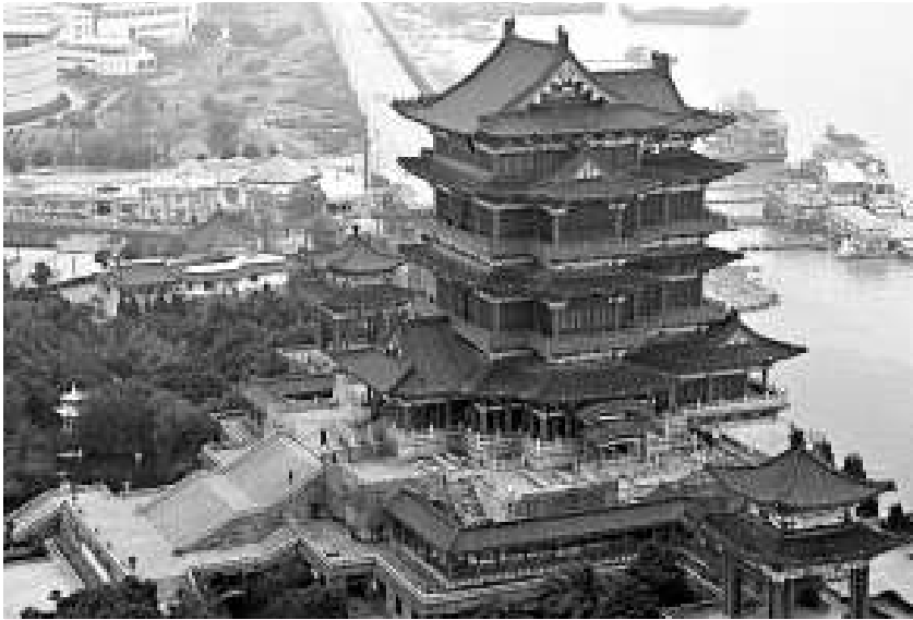
滕王閣因初唐才子王勃作《滕王閣序》天下揚名，被譽為「江南三大名樓」之首（資料圖片）

【本報訊】讓江南三大名樓之一滕王閣名聲大起的唐代著名詩人王勃的千古名篇《滕王閣序》近日驚現「日本版本」，而這一版本約四分之一的內容竟然與目前的「中國版本」不同。江西「滕學」專家稱，日本版本的《滕王閣序》似乎可破解諸多歷史文化之「謎」。