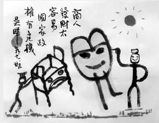
商人發財太容易，國家政權有危機（吳曄 繪）

管仲於是找到齊桓公說：「領導，我最近很憂慮，因為咱們齊國有不少商人做得太成功了。」齊桓公納悶了：「那是好事啊，證明咱們齊