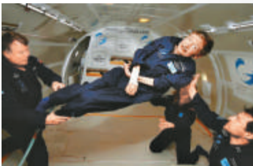
霍金雖然近乎全癱，但不減生活熱情，夢想遨遊太空。圖為他2007年體驗失重飛行

「好賭成性」的霍金，1991年又找上索恩和普瑞斯基爾，打賭裸奇點（naked singularities）是否存在。6年後，霍金認輸，