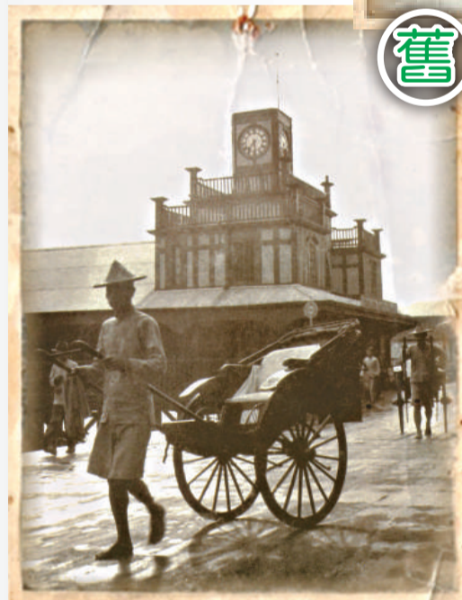
20世紀初第二代天星碼頭，與現今的仿古新碼頭同樣採維多利亞式建築風格