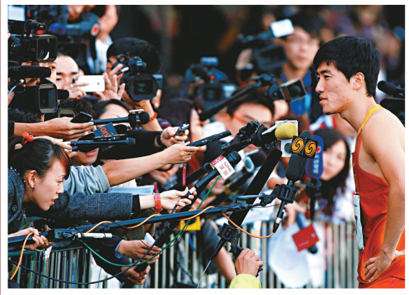
▲劉翔在奪得金牌後表示，很高興能夠勝出，雖然感到有點疲累，但對自己的表現感到滿意。