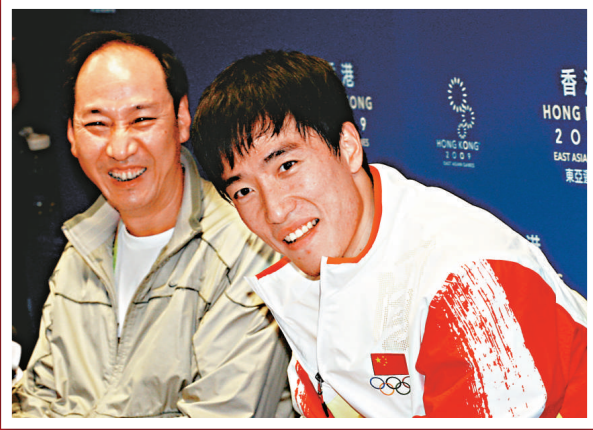
▲劉翔（右）與教練孫海平賽後出席新聞發布會。