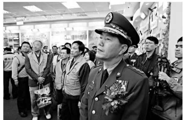
有媒體揭發曾任「國防部後備司令」的余連發（前）貪污六千萬情報費（資料圖片）

據了解，「憲兵」情報作業費除用來作為獎勵各「憲兵隊」掌握情資的獎金外，也經常被「憲兵」官員作為宴請諮詢對象之用。所謂的諮詢對象，就是外界所稱的「綠民」，會出現浮報情報費的問題，就是有「憲兵」官員藉宴請綠民之名卻行侵吞作業費之實。由於「國安局」在核發「憲令部」情報作業費請領時，也缺乏嚴格的審查機制，因此「憲令部」的情報作業費有很大黑箱作業的空間。