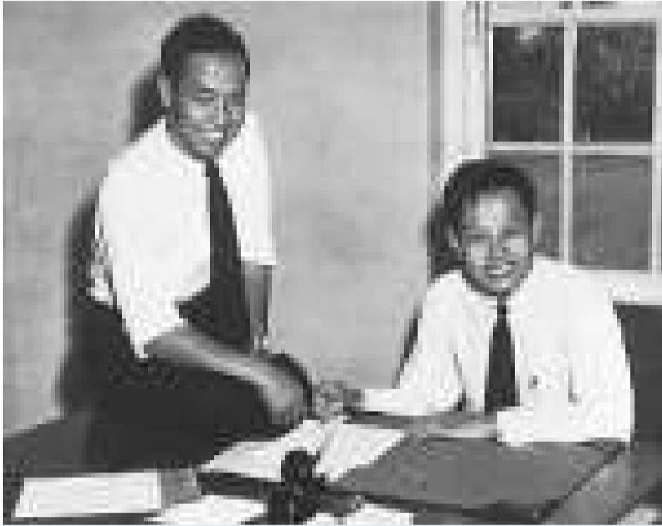
李政道(左)和楊振寧當年曾經是親密的朋友 (資料圖片)

你自己。你剛才說的是不真實的。」楊振寧接着出示了一張投影片，是李政道1956年塗寫的一張稿紙。這張稿紙在他們獲得諾貝爾獎之後曾經刊登在《今日物理》第10卷第12期，即1957年12月號的封面上。