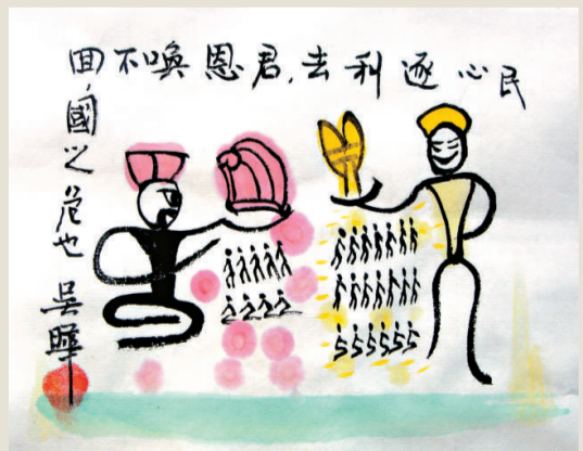
民心逐利去，君恩喚不回 (吳晔 繪)

資源管理超越時代境界 這就叫—— 風暴不是紙造的，和諧不是嘴說的；政府不願搞服務，和人民的感情肯定是隔閡的。 關於調節商品貨幣流通和控制物價的理論，在《管子》的《輕重篇》論述最詳。如《輕重篇·乘馬數》說：「穀重而萬物輕，穀輕而萬物重。」五穀是萬物的主宰，糧價高則萬物必賤，糧