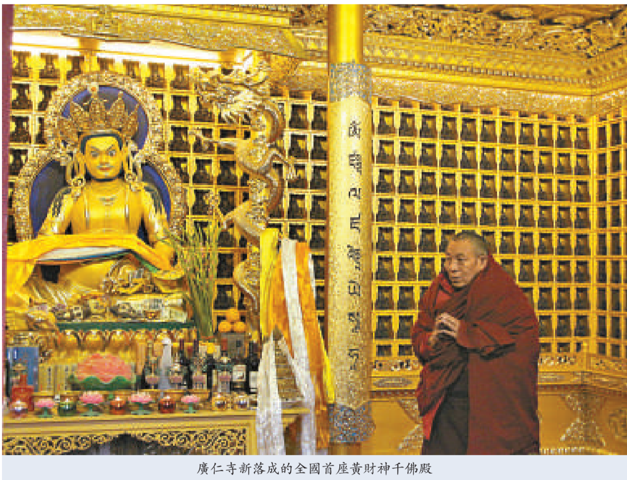
廣仁寺新落成的全國首座黃財神千佛殿

今晚6時，廣仁寺點燃了萬盞酥油燈「增長智慧明亮前程」，舉行紀念宗喀巴大師祈福法會。明晚還將舉行藏傳佛教消災免難大型火供法會，由嘉木樣·圖布丹活佛主法。在三天法會期間，活佛還將為廣大信眾摸頂加持，滿足信教群眾心願，為大家祈福吉祥。