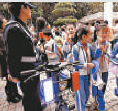
▲近日深圳發生多宗綁架案，警方選擇沉默

深圳市內發生了多少宗綁架案？深圳某公安分局民警稱，他基本上都掌握了南山每個學生綁架案的情況，但不能向記者透露。 有家長在接受記者採訪時說，如果警方在第一時間公布第一起案件，特別是若能及時公布今年十月十一月間發生的三起綁架案，引起家長及社會的關注，即使發生同類案件，被綁架者在學校和家長的教育下，也會有好的方法和綁匪周旋。