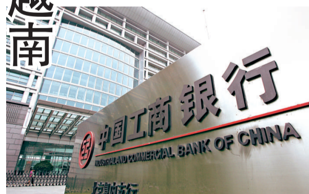
工商銀行是首家進駐河內的中國內地商業銀行

內地銀行自完成股改及上市後,均以「走出去」的發展策略進軍境外市場。其中,工行先後於澳門、印尼及南非進行併購,再於北美紐約開設分行,以及收購加拿大東亞銀行,銳意打造全球化金融平台。建行亦於北美設立分行後,再涉足歐洲版圖,在倫敦註冊設立子銀行。隨着內地與台灣正式簽訂《兩岸金融監理合作備忘錄》,市場盛傳兩行正積極籌備入股或收購台資同業。