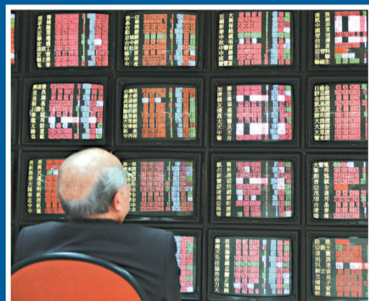
▲台灣股市投資者希望融入大中華市場