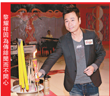
黎耀祥因為傳緋聞而不開心