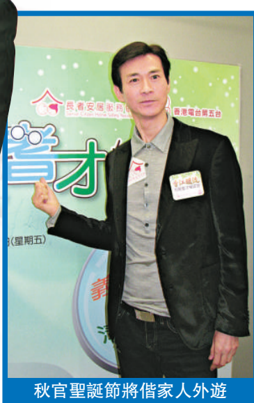
秋官聖誕節將偕家人外遊

秋官稱雖然忙和辛苦，但可能是一種享受，這一行最重要是運氣，有機會便要好好把握，好像之前他與欣賞合唱，兩父女也要不停練習。問到是否欣賞有其血統？他表示當然有，她對這行很有興趣，其實做這一行很辛苦。秋官亦說有定期做體檢，問他報告健康嗎？他笑說早前因為貪吃，故膽固醇高，可能在台灣之行吃得太多，現在已經沒事了。