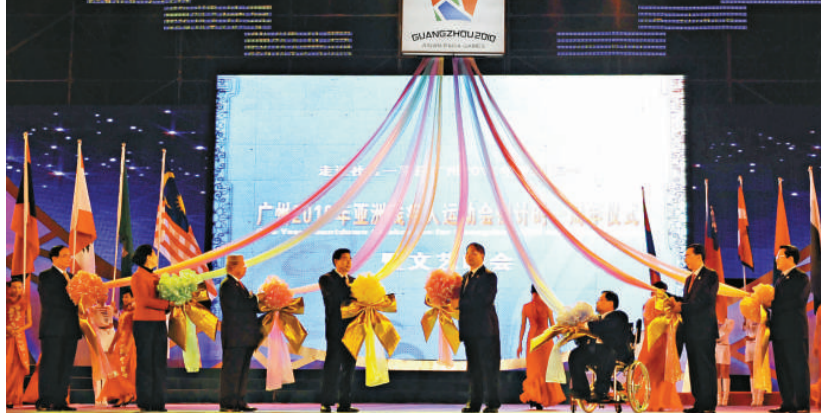
慶典儀式現場（本報攝）

亞洲殘委會主席阿布扎扎林宣讀廣州2010年亞洲殘疾人運動會邀請函，向亞洲41個國家和地區發出熱情的邀請。此時，大屏幕上電子郵件飛躍向天空，傳向亞洲各地。鮮花、流星、和平鴿的煙花造型在夜空中綻放，把儀式推向了高潮。