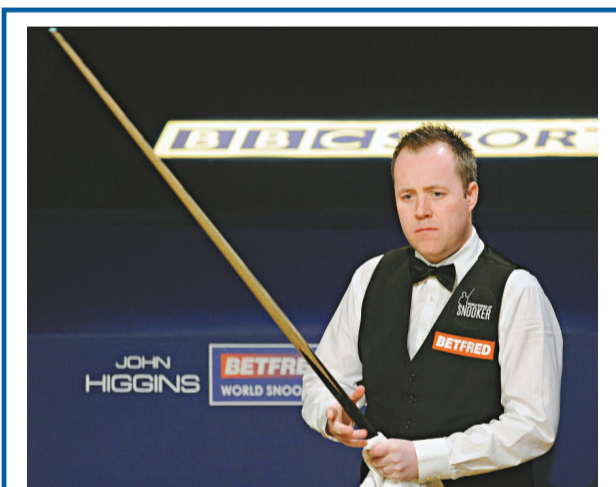
▲希堅斯在比賽中善於思考（資料圖片）