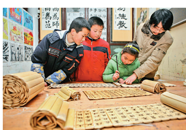
湖北省襄陽市陽光未來學校近日開展感受中國文化魅力主題教育活動，14日，老師指導學生進行竹簡書法創作 (新華社)

此後，經對到案犯罪嫌疑入的審查深挖和順線偵查，專案組先後赴江蘇、雲南、內蒙古、河北等地開展抓捕和解救工作。在當地公安機關的大力配合下，鐵路警方又抓獲犯罪嫌疑入十八名，解救嬰兒十二名，成功破獲此案。