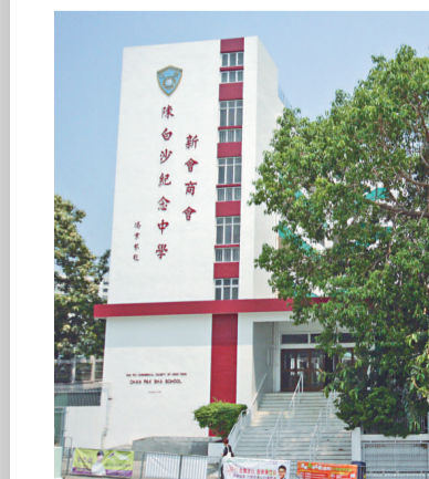
香港唯一以明儒命名的陳白沙紀念中學

陳白沙何許人也？他名陳獻章（1428-1500年），是明代理學家、教育家和詩人，生於廣東新會都村，後遷江門白沙鄉，世稱白沙先生、白沙子，更有真儒、活孟子之稱。白沙先生生平歷宣宗、英宗、代宗、憲宗、孝宗五朝，事母至孝，淡泊名利，