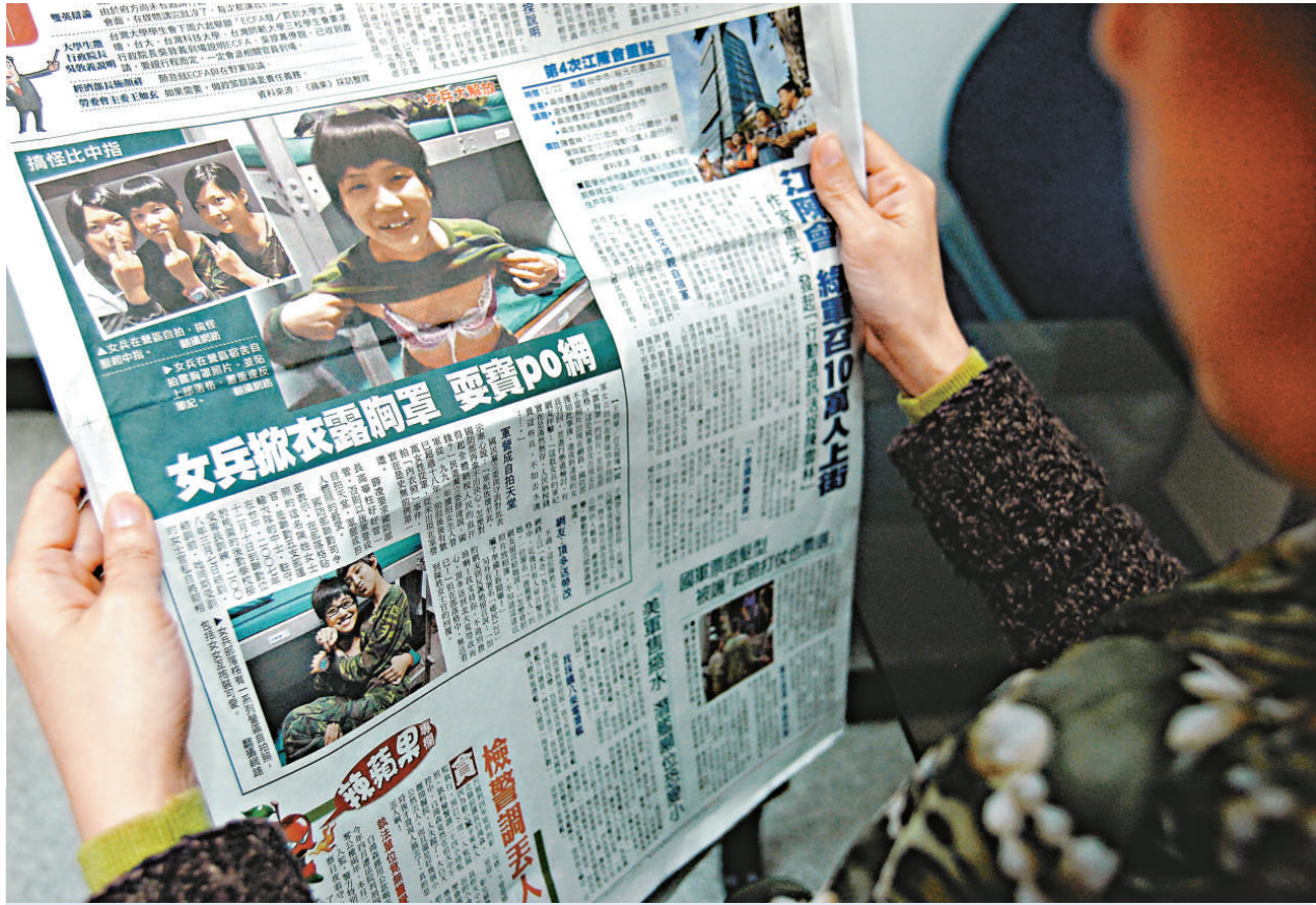
台灣媒體十五日報道了台軍「聯勤司令部」女性士官在營房自拍清涼照還貼上網路一事

媒體報道，據了解，今年台北一〇一的跨年煙火，頂新集團將聘請國際知名的大陸火藥設計師蔡國強，擔綱主設計的重責大任。媒體表示，擅長以火藥作為藝術語言的藝術家蔡國強，過去曾在世界各地完成不少膾炙人口的煙火施放「壯舉」，包括去年北京奧運的「大腳印」等，均讓人嘆為觀止，此次一〇一跨年煙火勢必精采可期。據了解，在煙火秀之後，將有可能在大樓外牆上打上代表頂新集團的企業標示，媒體表示，與往年相比，今年的跨年煙火將多了股濃濃的大陸味。