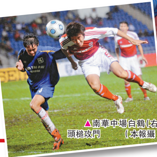
▲南華中場白鶴(右)頭槌攻門 (本報攝)