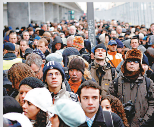
▲數千人在氣候變化大會會場外等待入場

最後一周的會議在十四日展開，代表、記者和環保人士都要等候數小時通過保安檢查進場。