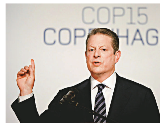
▲戈爾稱，北極的冰蓋最快將在五年內融化

戈爾兩年前曾憑一手策劃的電影《絕望真相》獲得奧斯卡最佳紀錄片和最佳電影原創歌曲兩個獎項，環保人士的形象深入人心。他今次出席氣候大會，發表上述最新研究報告，備受矚目。他在大會上引述加州蒙特雷海軍研究院氣候專家馬斯諾夫斯基的電腦模擬報告，指北極冰蓋消失的時間，將比美國之前預期的二〇三〇年還要早。戈爾指出，冰蓋消失的時間將提早十六年，換言之，五年內北極夏天將會變成完全沒有冰雪的世界。戈爾說：「這些數據是最新的，馬斯諾夫斯基獲取的推算資料顯示，有七成半的機會在五至七年內，北極持續數月的夏季將完全沒有冰雪覆蓋。」然而，馬斯諾夫斯基卻向戈爾投下一枚