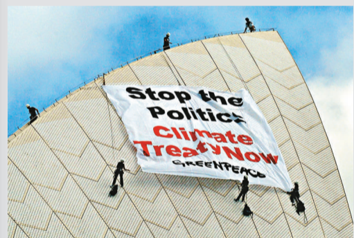
▲環保組織「綠色和平」五名成員星期二爬上悉尼歌劇院，拉開橫幅呼籲各國領袖解決分歧，在哥本哈根氣候大會上盡快達成協議。

他還認為，在資金援助問題上的強硬態度，意味着西方對中國的指責不攻自破，中國可以更自信地在哥本哈根會議上堅持自己的原則立場。