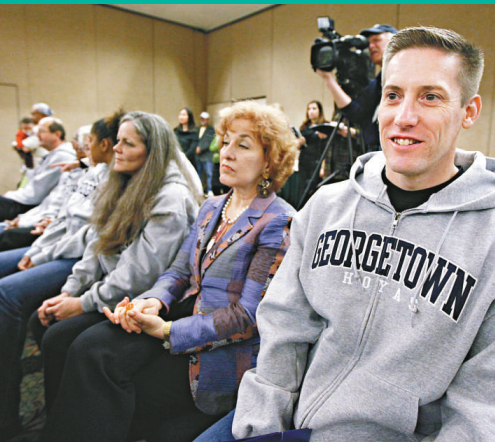
▲腎臟捐贈者出席佐治城大學的新聞發布會