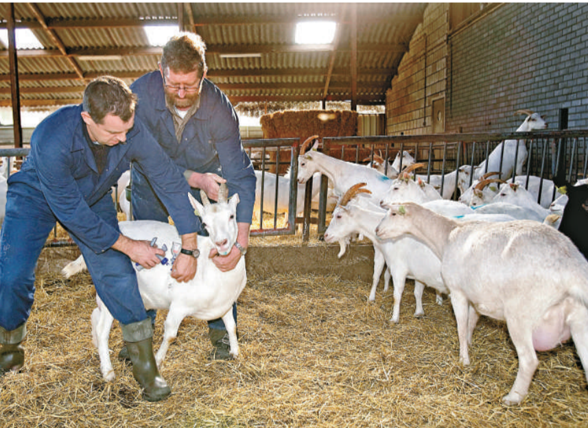
荷蘭防疫人員去年十月為羊隻打流感疫苗 (資料圖片)

【本報訊】據中通社阿姆斯特丹十六日消息：在遭到禽流感和甲型 H1N1 流感侵襲之後，荷蘭日前發現另一種新型流感傳播跡象，這種新型流感被稱為「羊流感」。當地媒體稱，至今已有一千三百多人感染這種流感，並已有六人因此死亡。