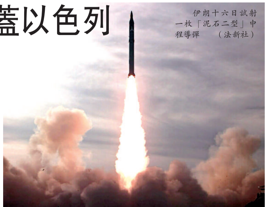
伊朗十六日試射一枚「泥石二型」中程導彈

分析認為，伊朗在核計劃問題同西方關係緊張，在這個時候，試射導彈會令雙方關係進一步惡化。