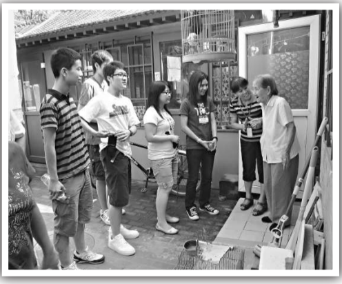
▲港專同學與居委會工作人員一起探訪胡同四合院的居民

我現在正在畫畫書。等我學好以後，我一定要畫一匹最漂亮的馬。我要把它掛在我的房間裡，好讓我天天都能看到它。