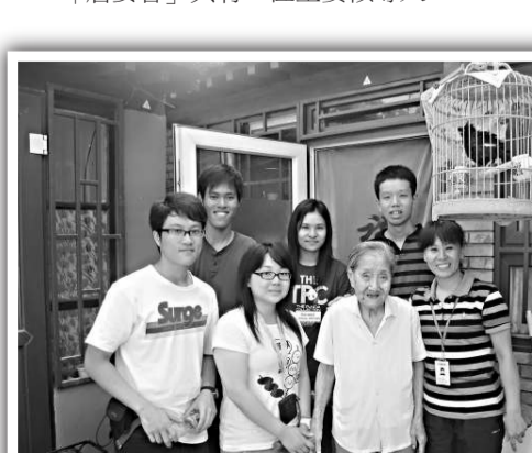
▲香港學生能參與北京居委會的工作，實屬難能可貴的機會

內地的社區最基層的組織要說是「居委會」了，「民安區」是大廈型社區，共有十座樓宇，約有四千人居住，其中流動人口接近一千多。社區裡有中學、公園、街道辦事處（居民申請福利資助的地方）、派出所、醫院等，設施頗齊全。「居委會」共有一位主要領導人，兩位副主任，兩位維持區內治安的公安，還有四位主任及四位文書。領導人主要負責一些地區大型活動，例如七一慶祝黨成立活動、八一建軍節活動、國慶綜合晚會等，其他主任分工包括專責處理康復、生育計劃、流動人口、青年事務活動等，並與區內學校聯絡以舉辦活動等；還作爲與市民溝通的橋樑，傳達國家頒布的新政策、計劃及服務，而居委會的工作人員均要參與處理大廈的問題；除了有兩名公安鎮守，還有一名調解員負責處理居民問題，提供服務諮詢。