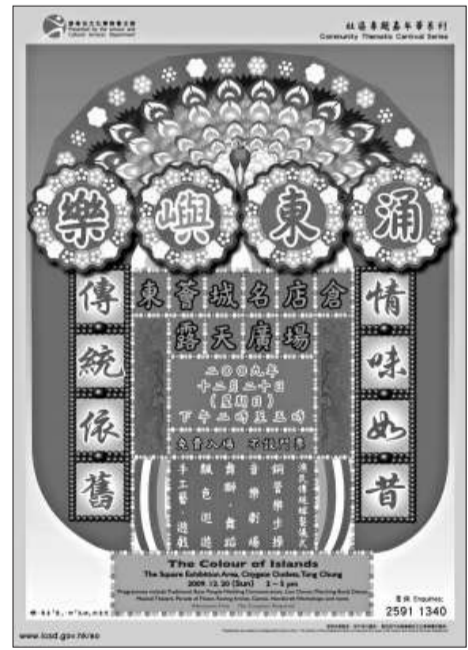
▲本月二十日東涌將舉行大型文化活動

推介活動：康文署於2009年12月20日，下午二時至五時，於東涌東薈城名店倉露天廣場，舉行一個名為樂嶼東涌的文化活動，內容有漁民傳統娶妻儀式、銅管樂步操、音樂劇場、舞獅、舞蹈、飄色巡遊、手工藝、遊戲等。