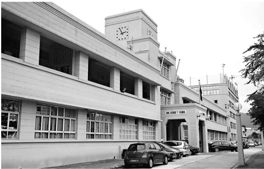
英皇佐治五世學校是九龍歷史最悠久的國際學校