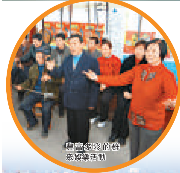
豐富多彩的群眾娛樂活動

文化事業扎實推進。 加強基層文化設施建設，銅冶、寺家莊等5個鄉鎮文化站年內將全部建成投用；廣泛開展「三下乡」、彩色週末及登山比賽等群眾性文體活動，在全國「飛象杯」農民健身秧歌邀請賽上榮獲一等獎。