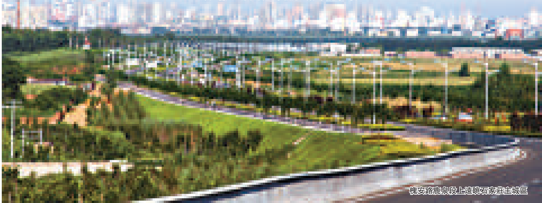
槐安路鹿泉段上遠眺石家莊主城區