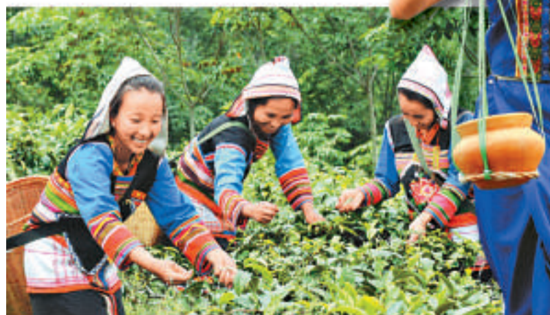
▲景洪市基諾山基諾族姑娘在茶園裡採茶（新華社）

據西雙版納古茶樹古茶園資源普查顯示，境內古茶樹古茶園分布區域達13萬畝，百年以上古茶園共82234畝，有7個品種，是迄今已知的全國古茶樹資源分布面積最大、品種最多的古茶區。而西雙版納州的勐海縣則保持了雲南省普洱茶第一產茶、出口大縣的地位。茶文化旅游也成為西雙版納發展的重點之一，包括陽光茶文化科技園雲茶源景區，易武古茶山和大渡崗萬畝茶園等。