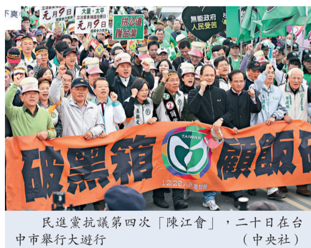
民進黨抗議第四次「陳江會」，二十日在台中市舉行大遊行