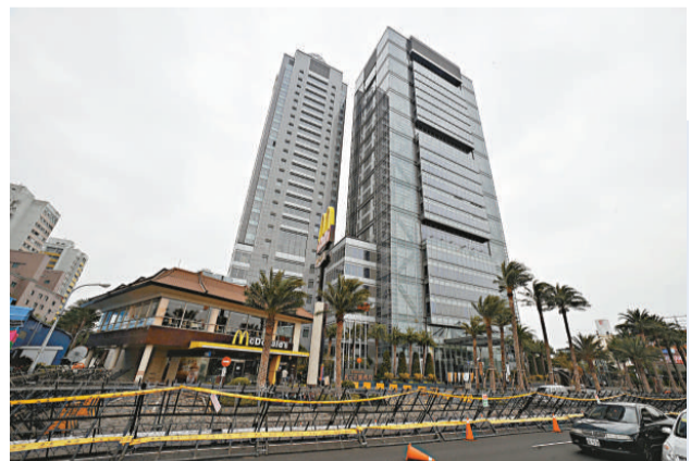
「陳江會」將於明天在裕元花園酒店舉行。圖為酒店周邊設置大型拒馬

此外，馬英九於二十日再度下鄉到彰化，對傳統產業宣傳兩岸簽署ECFA的重要性，同時選定本土企業華貴牌絲襪工廠拍攝「治台周記」，爭取民間支持ECFA。