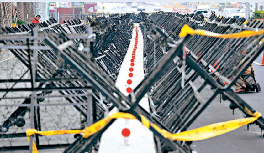
「陳江會」將於二十二日在台中市登場，為保障會議及出席人員安全，警方在會議酒店周圍設置拒馬