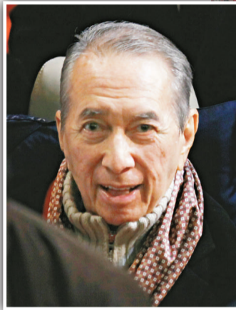
▲留醫數月、首度公開露面的何鴻燊受到傳媒關注

何鴻燊約於中午十二時離開澳門返回香港。他上一次公開露面，是今年七月底出席澳門博彩商會成立儀式並由他出任主席。