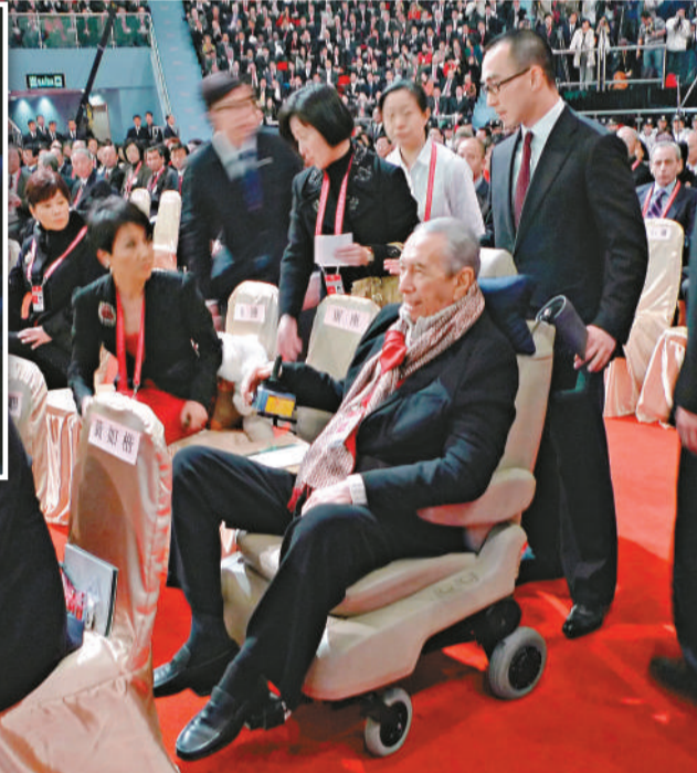
▶何鴻燊出席澳門第三屆特區政府就職典禮 (中央社)