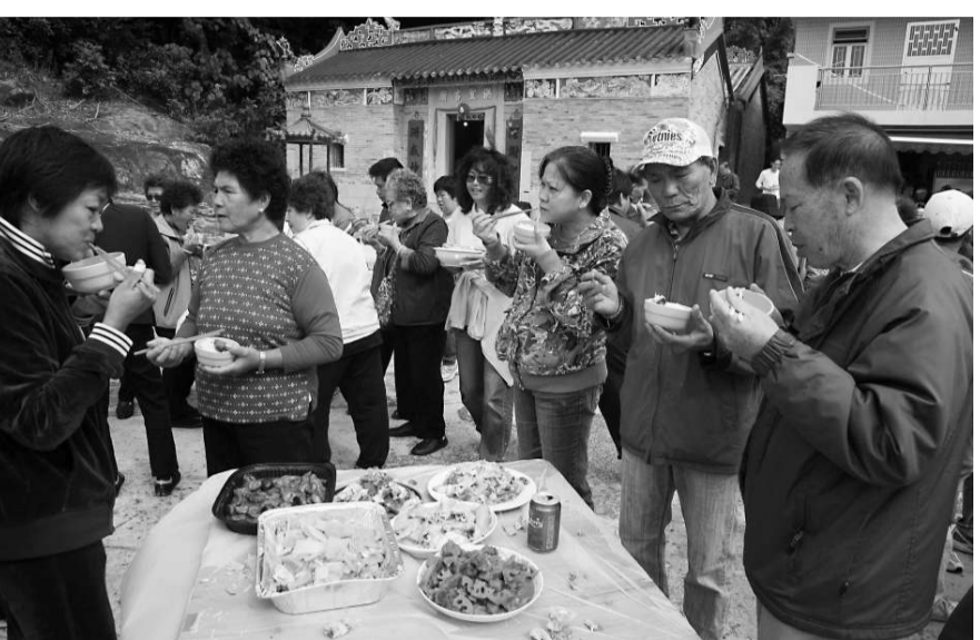
瀝洲水上人拜祭水仙爺後在廟前廣場進食

中國南方居民自古至今信奉許多不同水神，最普遍的是天后，其他有洪聖、譚公、北帝、龍母、朱大仙等，還有盛行於漁民社區的水德和水仙爺。但隨著水上人遷居岸上，有關信仰已逐漸式微，現今只有西貢瀝洲的水上人仍定期慶祝水仙爺誕。從漁民口中得知，西貢牛尾洲以前曾有一間水仙爺廟，後來英軍在此區操炮而遭棄置，繼而頹圮。瀝洲的洪聖古廟內亦供奉了水仙爺，每年農曆十月初十為誕期，漁民按習俗前往拜祭。即使現今大部分居民已遷離瀝洲，但每年此刻仍有數十名水上人及其後代乘船返回瀝洲拜祭。他們除了供奉祭品和上香外，我還看見一名漁民俯身上穿越供桌底部的狹窄空間，以求轉運，如此行為與打醮期間村民彎腰穿過大士王腳下有關曲同工之意義。最重要的一刻是男性成員齊集廟內擲杯，藉此了解神靈是否滿意。至於女性成員則在廟旁的廚房忙於煮食，之後在廟前空地擺放桌子，大家站立進食，隨意走動來茶，顯露出水上人無拘無束的性格。瀝洲的主要保護神是洪聖，島上最重要的節日亦是洪聖誕，但村民沒有忘記水仙爺，畢竟這位神靈也是他們及其先輩的心靈寄託。瀝洲水仙爺誕值理會每年撥出款項籌辦水仙爺誕，讓居民定期回來拜祭，祈求一切順利，同時又藉着這個節日，讓分散各地的村民再有一次相聚機會。