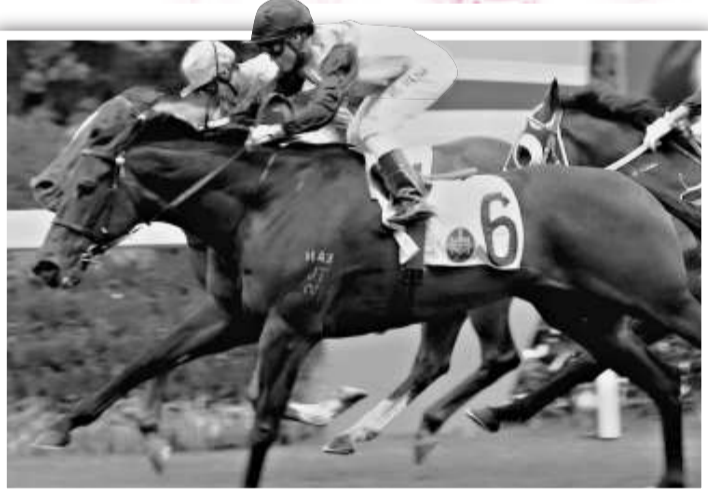
「多多昇」(六號)狀態續好，有力爭取季內第三度頭馬

晨操速遞 祖健 昨星期日出試馬並不疏落，周三有賽馬馬匹逾二十匹進行快跳考驗，東、蘇及何三個馬房最積極，現將所見簡述如下： 「威利多多」試兩段，沿中外檔走，前段速度不快，直路予人步伐開揚有力，最後五十米增進時氣勢更佳，狀態保持前仗贏馬時水準。 「大師傅」試兩段，沿中檔快跳，最後一段加快腳步，勁度比前有明显進展，過了終點之後餘勢甚強，直衝至對面直路才收得停。 「多多昇」試兩段，全程貼欄走來步頭有力，神色生猛，毛水有光澤，馬身輕盈，狀態依然具爭拚水準。 「加州滿意」與「香檳王」同跳兩段，前駒貼欄先放，後駒外檔跟隨，「加州滿意」走來步頭有力，比上回有明显進步，「香檳王」上力一般，現階段進展不大。 「輕越直前」跳一段，扣住在中檔走來步頭上力，衝過終點後餘勢十分強，單以狀態而言仍在水準之上。 「好味皇」試兩段，沿中外檔按韋至最