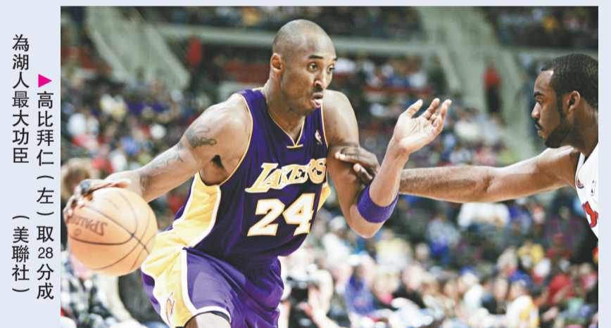
為湖人最大功臣 高比拜仁（左）取28分

【本報訊】綜合外電美國、洛杉磯二十日消息：湖人於周日的NBA常規賽，作客以93：81擊敗活塞，這是湖人8年來首度橫掃對手。至此，湖人以4場全勝的佳績完成東岸征途，亦以22勝4負的驕人戰績，繼續成為NBA成績最佳的球隊。