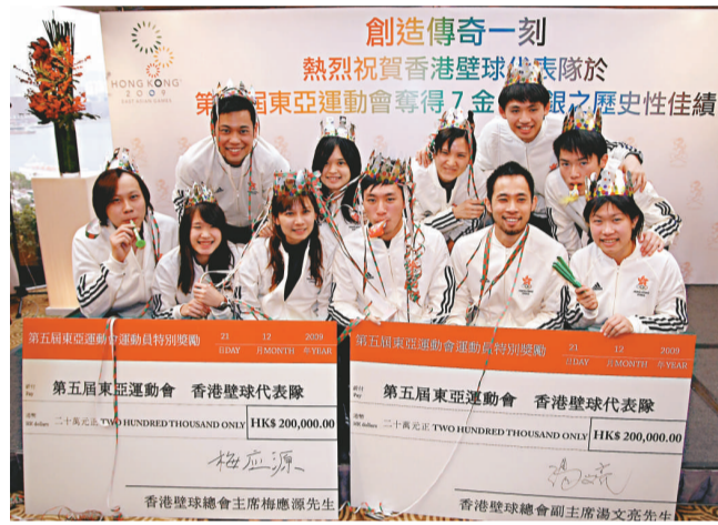
▲港壁隊成員戴上聖誕裝飾，慶祝獲得40萬元特別獎金這份「大禮」