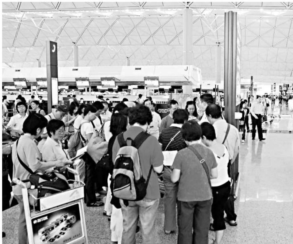
聖誕外遊季節，機場旅行團匯集，又再見人頭湧湧

民航處發言人提醒在節假期出外旅遊探親人士，由於臨時加班機數量比正常航班有明顯增加，須提前做好各種準備聯繫，注意各種情況會否發生變化。