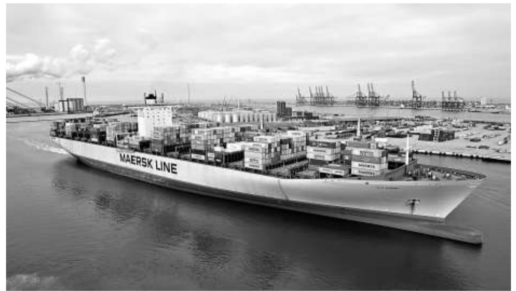
馬士基在高雄港經營碼頭，又想派船在台灣註冊，左右開弓，盡得漁人之利

據上海外高橋邊檢站統計，截至本月 16 日，由往來台灣和上海的兩岸直航船舶已達 1298 艘次，較去年增加 2.2 倍。在兩岸直航前，經第三地往來兩岸的方便旗船有 27 艘，境外航運中心船舶 11 艘。直航後，台灣船東將方便旗船轉回台灣註冊，到今年 12 月只有 10 艘。