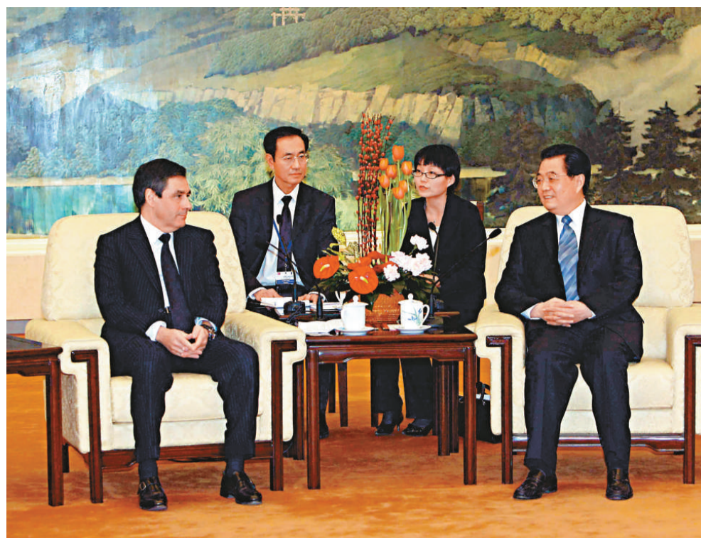
▲中國國家主席胡錦濤在北京人民大會堂會見法國總理菲永

菲永說，今後若干年，中法兩國應該不斷地研究面向未來的農作物新品種，這些新品種應該更能夠適應氣候變化和中國北部乾旱氣候。菲永強調要加強與中國的高等教育合作，鼓勵雙方學生相互交流，並將與中國的幾十所大學合作，培養英才。