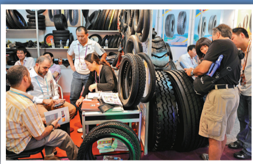
▲中國輪胎企業唯有面對挑戰，圖為採購商在廣交會上選購輪胎

世界貿易組織（WTO）的最高仲裁員維持八月的裁決，指中國限制進口美國音樂、電影和書籍，違反世貿規則。另外，華盛頓又投訴中國操縱生產鋼鐵和鋁的主要原料的價格。