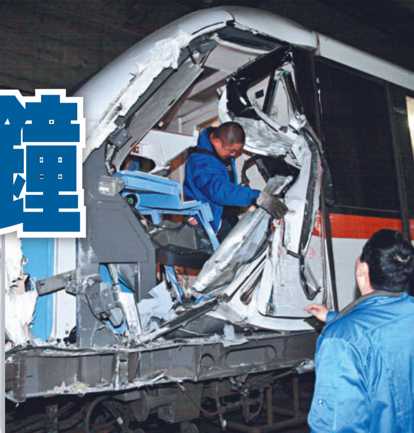
▲擦碰事故中損壞的上海地鐵1號線列車