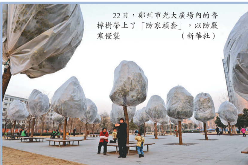
22日，鄭州市光大大廣場內的香樟樹帶上了「防寒頭套」，以防嚴寒侵襲

《人民日報》香港分社負責人鄭重否認涉案女事主為該報記者。他表示，經查詢，《人民日報》各部門及其所屬人民網和其他子報刊均無此人。