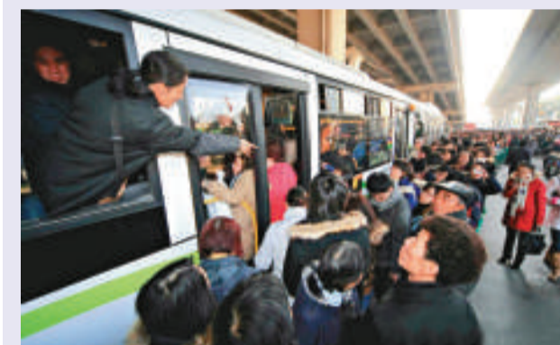
▲地鐵故障導致停運，沿線公交擁擠不堪 (網上圖片)