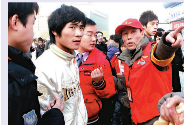
▲上海交管部門積極組織力量疏散滯留乘客