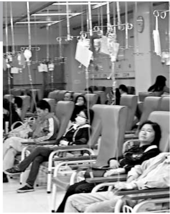
▲流感病人在醫院門診部打吊針

根據監測數據，廣東省流感樣病例佔門急診就診比例和甲流就診佔門急診就診比例從11月初開始顯著上升，11月最後1周達到甲流疫情高峰，從12月第1周開始連續3周下降，顯示廣東省採取綜合防控措施取得實效，甲流第一波發病高峰已過，目前處於第一波疫情持續下降期。省疾控中心對56株甲流病毒株進行基因測序分析，沒有發現明顯病毒變異，沒有發現對達菲耐藥情況。