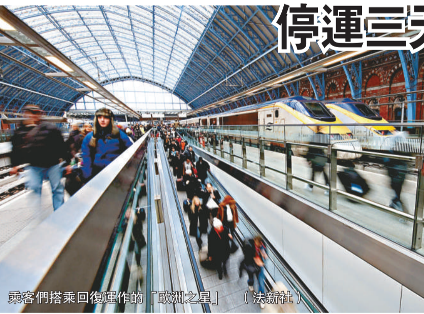
乘客們搭乘恢復運作的「歐洲之星」

另據法國媒體報道，二十一日午後，法國南部主要城市馬賽、尼斯的許多街區都遭遇了大面積停電。