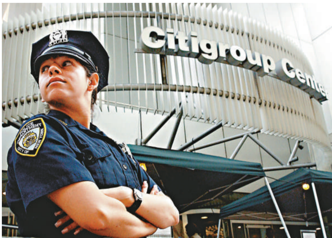
一名紐約警察站在花旗集團總部門口 (資料圖片)

這起攻擊事件凸顯出，網絡空間中的犯罪與國家安全威脅之間的界限日漸模糊。據知情人說，黑客還攻擊了