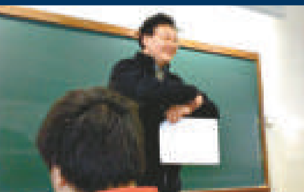
▲死者教學生動，深受學生愛戴（網上圖片）