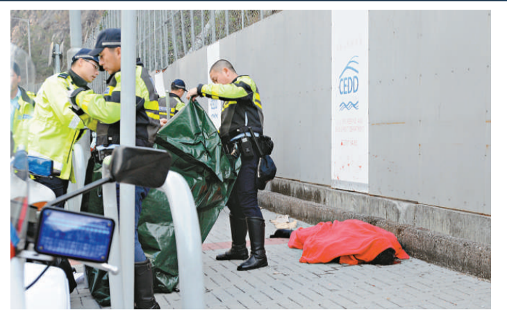
▲姓諸男教師捱撞後頭部受重創全無氣息，警員取來帳篷將其屍體覆蓋