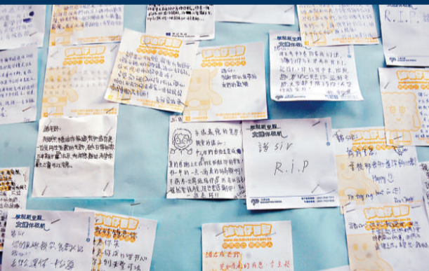
▲學校壁報板貼滿學生的心意卡

的懷念。校方將會發出家長信，家長若發現子女情緒需要支援，可致電學校聯絡，校方在聖誕假期也有教職員駐校。昨日所見，學校壁報板心意卡及網上悼念區，有許多學生留言悼念諸，有人表示失去一位好朋友，更有學生形容視諸為半個父親。