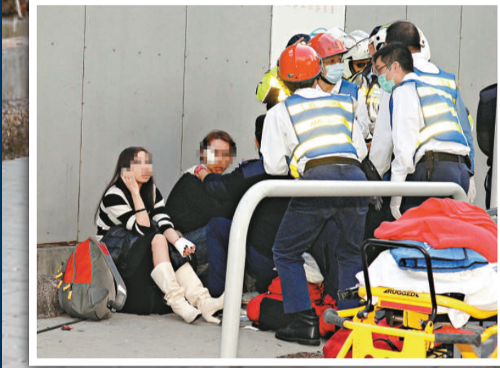
▲肇事司機及女乘客事發後坐在路旁等候治理