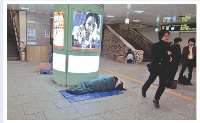
深夜的新宿地鐵站