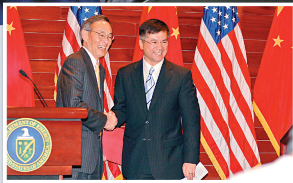
美國能源部長朱棣文和商務部長駱家輝(右)(資料圖片)

除了朱棣文，目前有多名華裔擔任奧巴馬內閣要職。今年二月二十五日，駱家輝獲美國新任總統奧巴馬提名出任商務部長。在許多美國人、特別是華裔美國人眼中，駱家輝是華裔中的「奧巴馬」，同樣是實現「美國夢」的一個代表。此外，還有第一位擔任白宮內閣秘書的華裔——盧沛寧，擔任國安部法律顧問的方富宇等，美國政壇正湧現越來越多的黃皮膚精英。