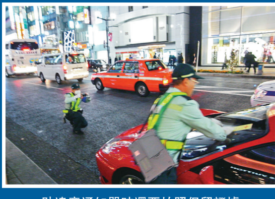
貼違章通知單時還要拍照保留證據