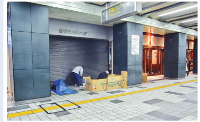
露宿者搭紙板禦寒