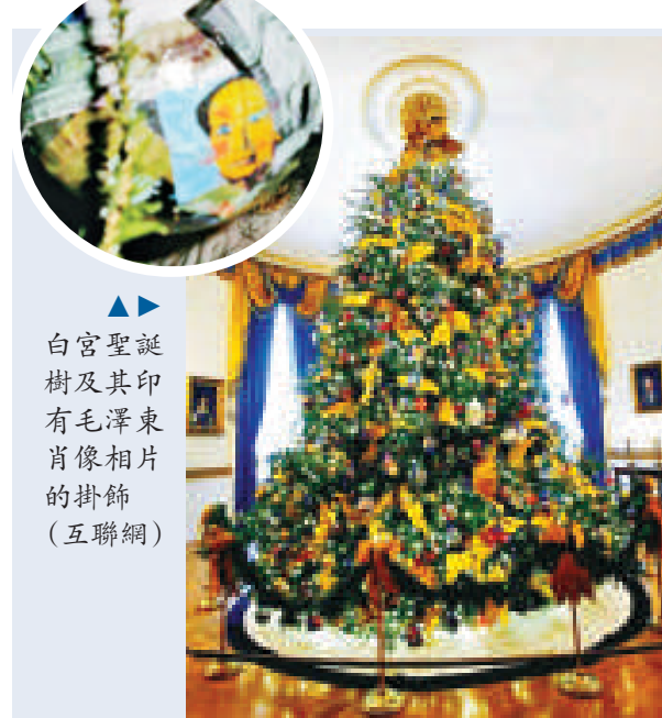
白宮聖誕樹及其印有毛澤東肖像相片的掛飾

毛澤東，從一九四三年到一九七六年逝世之前，一直擔任中共中央主席，是中國共產黨的最高領導人，他也被視為現代世界歷史中最重要的人物之一。