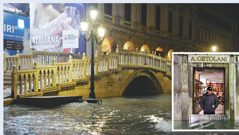
嚴重水浸的威尼斯

威尼斯今次水浸程度不及去年，因為去年創下高出海平面一百六十厘米的新高，是二十多年最嚴重的。