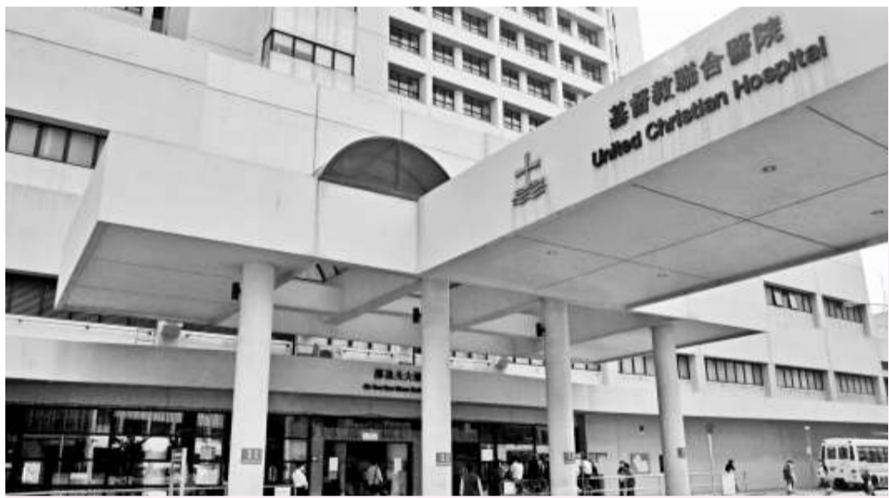
發生病房助理拍打病人事件的聯合醫院

【本報訊】公立醫院又爆醜聞！聯合醫院昨日證實一名病房助理拍打病人，現時被調職。院方早前收到一名職員報告，提及一名病房助理拍打病人，其後再收到匿名電郵，指助理涉嫌拍打病人，並用沾有尿液的尿片「摔」病人面部。院方表示，這名助理承認曾輕拍病人臉頰，暫時未收到病人及家屬投訴，正在調查事件。病人互助組織聯盟對事件表示遺憾，打病人是不能接受。