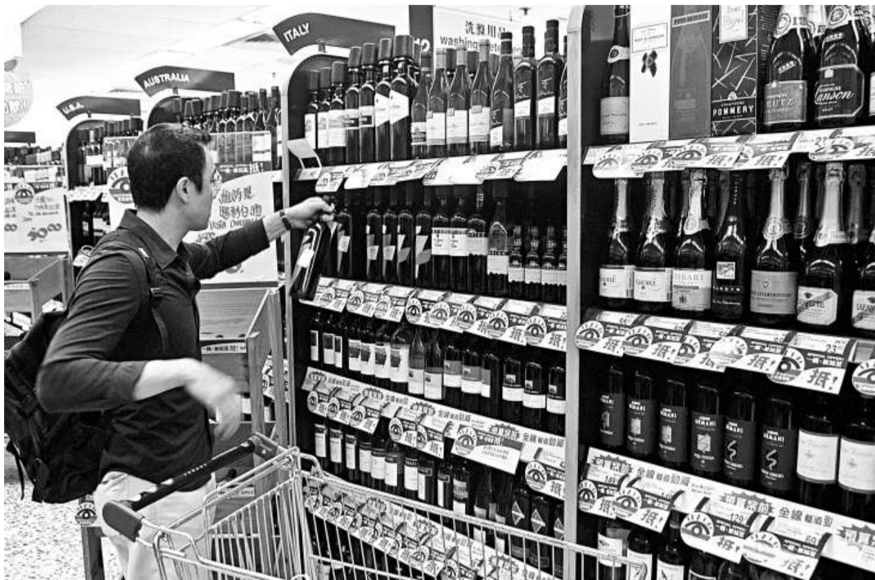
超市售賣的紅酒，價錢由數十元至千元都有

控罪指稱，今年3月30日，被告在太古城中心內的Apia超級市場，偷竊兩支共價值一千三百七十元的Chateau Pavie Macquin紅酒。據控方案情透露，案發當日晚7時許，超市保安員發現身穿西裝的被告，推着購物車在紅酒貨品區內徘徊，他暗中留意其舉動。被告走到一個紅酒貨架前，取下一支價值六百八十五元的2006年Chateau Pavie Macquin紅酒放在購物車內，被告再轉向另一邊較矮貨架，將一支同一款紅酒放入購物車。保安員覺得被告形跡可疑，遂繼續監視。被告推着購