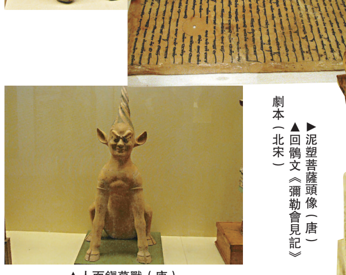
人面鎮墓獸(唐) 泥塑菩薩頭像(唐)