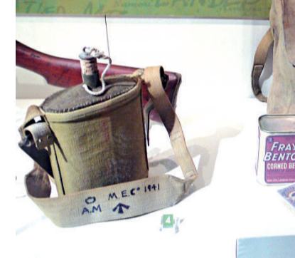
這些是突圍隊伍逃亡時所發的配給品...