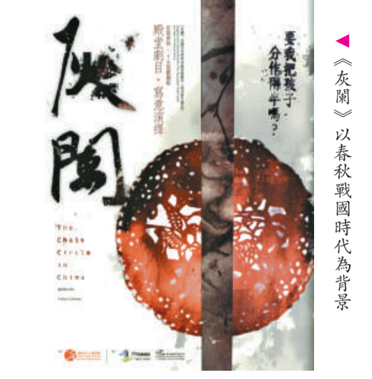
《灰闌》以春秋戰國時代為背景