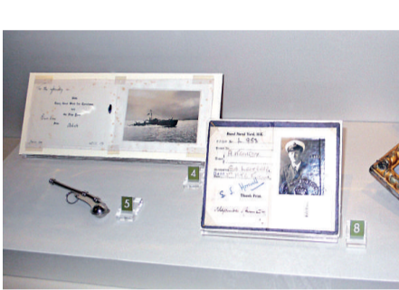
一九四〇年，一名參與突圍的英軍肯尼迪寄給家人的聖誕卡上...