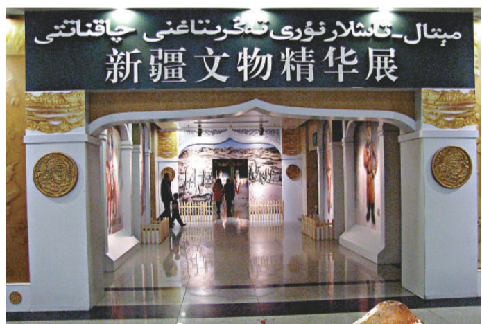
新疆文物精華展場 彩繪舍利盒(北朝) 蹲跪銅武士俑(戰國)