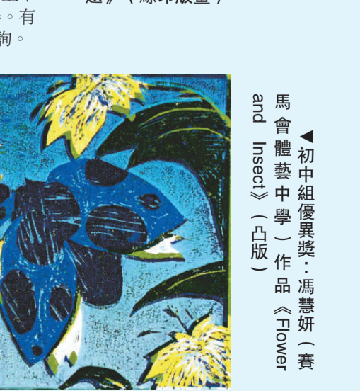
初中組優異獎：馮慧妍(賽馬會體藝中學)作品《Flower and Insect》(凸版)