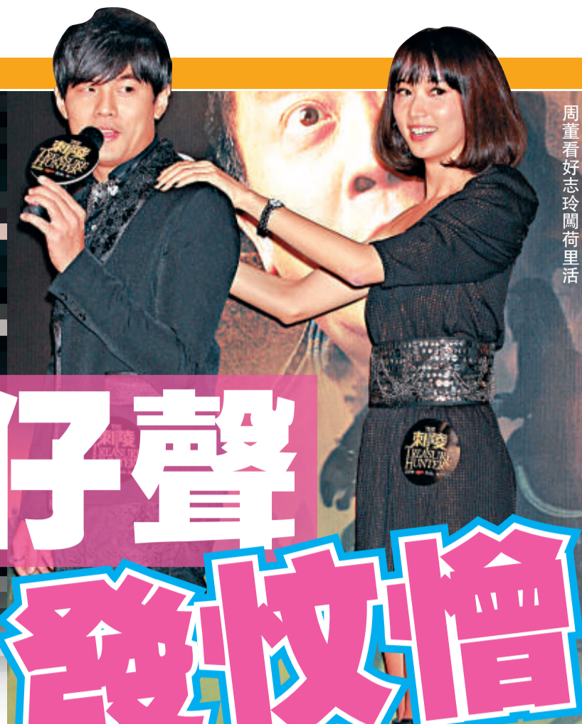
周董看好志玲闖荷里活