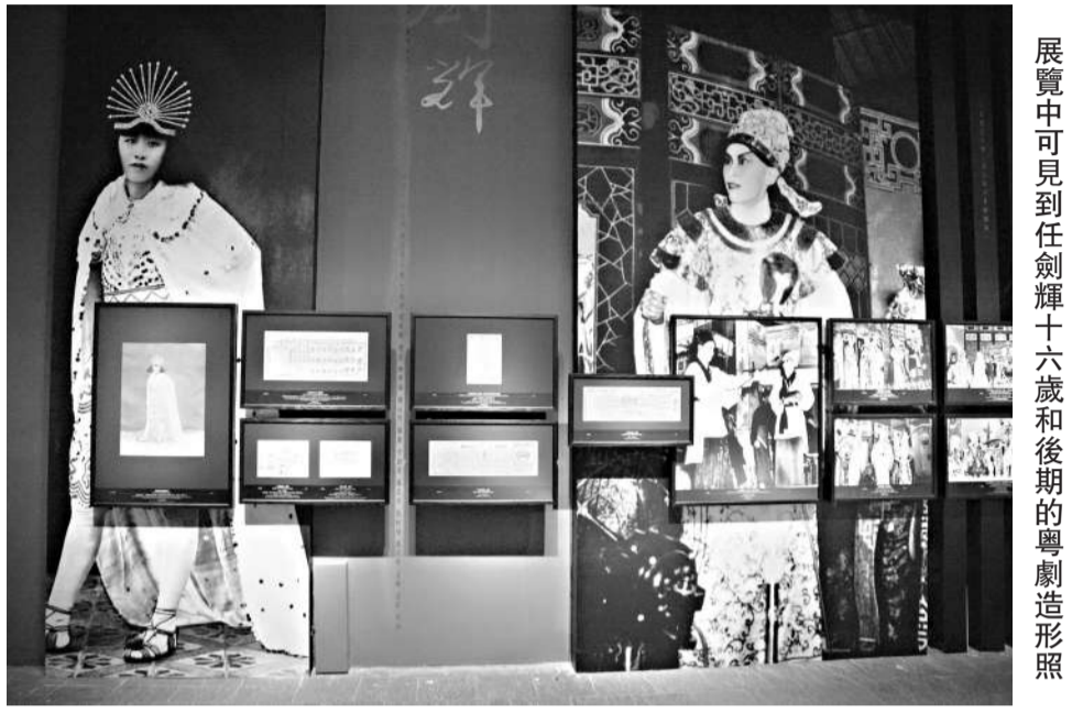
展覽中可見到任劍輝十六歲和後期的粵劇造型照

香港文化博物館以唐滌生和任劍輝為題舉辦「梨園生輝」展覽，透過三百件文物回顧這兩位粵劇大師的藝術歷程。粵劇自明清發展以來，因動亂、巨變和新思潮的影響，曾出現過多次高低起伏。到二十世紀三十年代，任劍輝和唐滌生先後崛起，對粵劇的復興作出了不可磨滅的功勞。 任劍輝十四歲（一九二七年）開始在廣州學習粵劇，那年中國共產黨在廣州起義，廣東當局嚴格審查戲劇，造成上演的粵劇劇目平庸，觀衆頓減。其後戲班改良劇本、音樂、唱腔和布景，重新吸引戲迷，而任劍輝於此時冒起，一九三〇年代晉升為文武生，在多個劇團擔當台柱。 與此同時，唐滌生來港加入薛覺先的「覺先聲劇團」，負責抄曲工作。一九三八年他二十歲時，編寫了第一部粵劇作品《江城解語花》，由白駒榮主演，從此展開其編劇生涯。 二戰後，任劍輝隨「新聲劇團」移師香港演出，並開始與唐滌生合作，演活其筆下許多人物。一九五六年，任劍輝與白雪仙組成「仙鳳鳴劇團」，唐滌生擔任劇務，這段時間是任、唐二人在舞台上最巔峰的日子。可惜唐滌生於一九五九年在利舞台觀賞其作品《再世紅梅記》首演時，因腦溢血昏倒不治，享年四十二歲。「仙鳳鳴劇團」為此停演了兩年，一九六一年任劍輝再踏舞台，演出《白蛇新傳》，之後逐漸淡出，全心栽培新人。