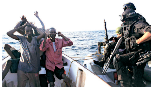
▶ 葡萄牙海軍準備拘捕幾名索馬里海盜

今年以來，索馬里沿海累計已經發生80多起海盜襲擊事件，平均每4天就有一艘船遭劫。11月29日，一艘希臘油輪成為今年被劫的最大船隻。索馬里自1991年以來一直戰亂不斷，沿海地區海盜活動猖獗，被國際海事局列為世界上最危險的海域之一。中國、美國、俄羅斯、法國、英國、印度、日本等國分別出動海軍艦隊，聯手在亞丁灣護航。被索馬里和也門環抱的亞丁灣位於印度洋與紅海之間，是從印度洋通過紅海和蘇伊士運河進入地中海及大西洋的海上咽喉，戰略地位十分重要。聯合國多次表示，索馬里沿海的海盜活動已經對國際航運、海上貿易和海上安全構成嚴重威脅。目前，有關國家和國際組織正在加大在這一海域的護航力度。