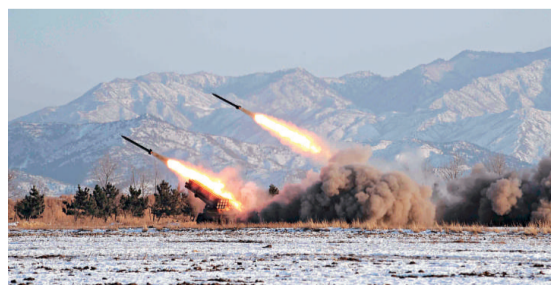
▶ 朝中社提供的朝鮮部隊進行射擊訓練的照片 (資料圖片)

7月4日美國獨立日，朝鮮向東海發射了7枚導彈，其中兩枚導彈是飛毛腿導彈。韓國官方人士認為，朝鮮發射的飛毛腿導彈射程較遠，威脅性強。輿論認為，朝鮮專門挑選特定紀念日發射導彈是為吸引美國的關注。美國方面表示，朝鮮在此刻發射導彈「沒有益處，是危險的」。日本政府對朝鮮連續發射導彈的舉動深感不安，日本官房長官為此事特意發表聲明，稱朝方此舉「違反聯合國安理會決議。決不能容忍該行為，對此提出嚴重抗議」。朝鮮研發系列導彈，使朝鮮半島局勢更加複雜化，也使六方會談面臨嚴峻挑戰。