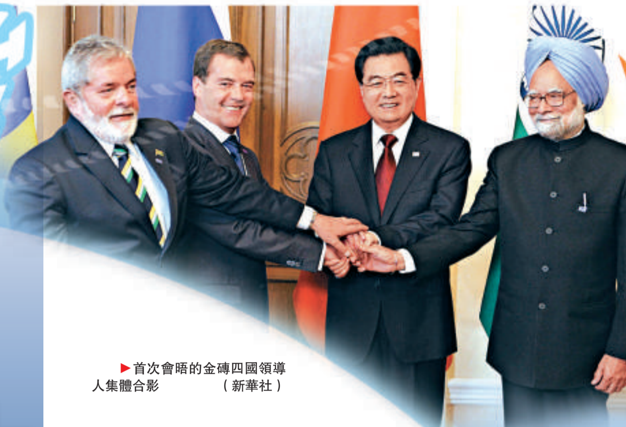
▶ 首次會晤的金磚四國領導人集體合影