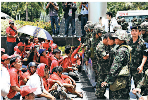
▶ 泰國反政府示威者在東盟系列峰會會議中心前靜坐示威

分析家們指出，東盟系列峰會被取消不僅使泰國國家形象受損，也使泰國經濟蒙受重創，特別是作為國民經濟支柱產業的旅遊業遭受的損失最大。泰國輿論也認為，街頭政治運動使百姓生活受到嚴重影響，使「國家利益成為犧牲品」，「黃衫軍」和「紅衫軍」之爭只會使百姓遭殃。