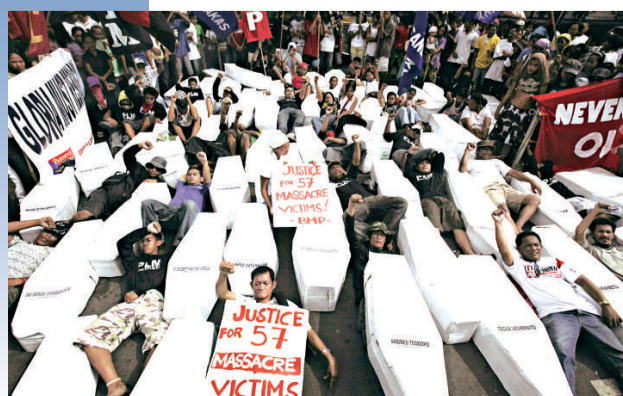
▶ 示威者在菲律賓首都馬尼拉手舉棺材模型抗議政治屠殺事件