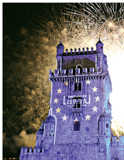
▶ 在葡萄牙首都里斯本舉行的慶祝《里斯本條約》正式生效儀式上，焰火照亮世界文化遺產貝倫塔

12月1日，在獲得歐盟全部27個成員國批准後，《里斯本條約》正式生效。作為《歐盟憲法條約》簡化版的《里斯本條約》刪去了不受歡迎的憲法意味的內容，增添了使歐盟決策過程更透明、更民主的條款。但在單一貨幣等核心問題上，條約仍採取了迴避態度。歐盟27國領導人12月19日在布魯塞爾召開特別峰會，一致選舉比利時首相范龍佩為首位歐洲理事會常設主席，來自英國的歐盟貿易委員凱瑟琳·阿什頓當選為歐盟外交和安全政策高級代表。根據職務特點和內容，這兩個職務被習慣地稱為「歐盟總統」和「歐盟外長」。