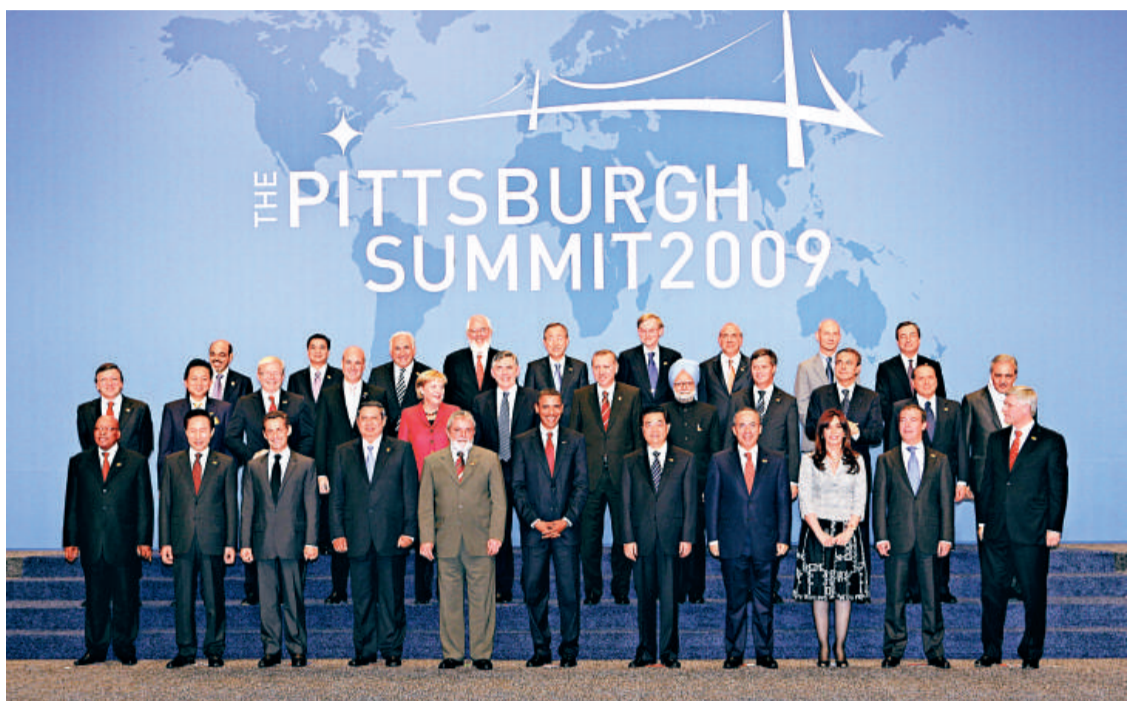
▶ G20匹茲堡峰會領導人全家福