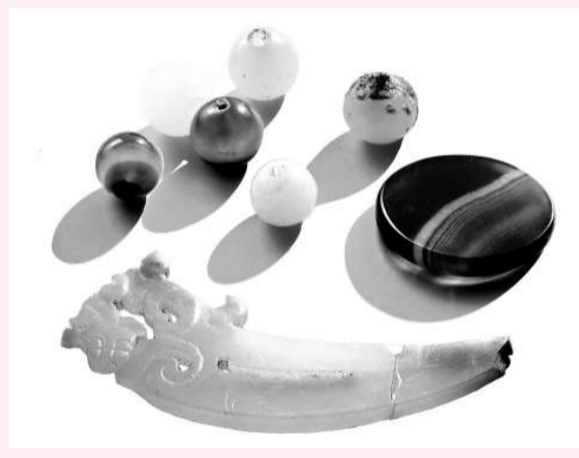
▼曹操高陵出土的玉和瑪瑙裝飾品