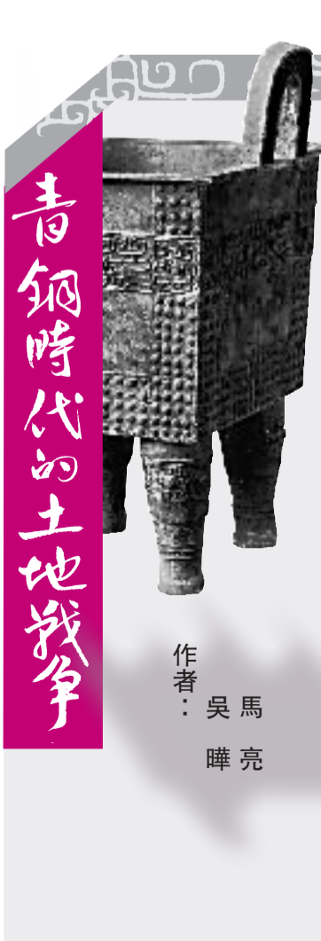
青銅時代的土地戰爭

（三）墓葬位置與文獻記載、出土魯潛墓誌等材料記載完全一致。據《三國志·魏書·武帝紀》等文獻記載，曹操於建安25年（公元220年）正月病逝於洛陽，2月，靈柩運回鄴城，葬在了高陵，高陵在「西門豹祠西原上」。調查資料顯示，當時的西門豹祠在今天的漳