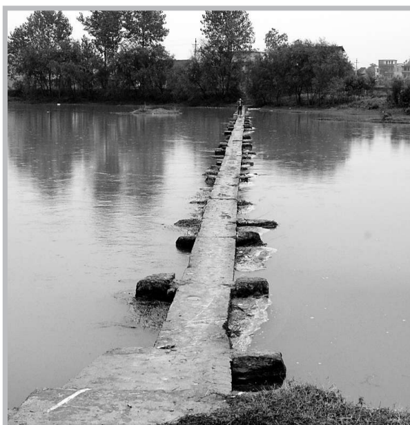
歷經500年風雨沖洗如故的新邵木橋基踏水橋

【本報記者劉奇雄長沙二十七日電】日前，湖南省新邵縣文物部門在第三次全國文物普查時，在該縣小塘鎮渡頭橋村與大院村之間發現了一座距今500多年、歷經洪水沖刷而不坍塌的木橋基踏水橋。隨同行前行的湖南省文物考古專家認為，該橋精湛的建築質量堪稱我國古代木質建橋史上的奇跡之一。