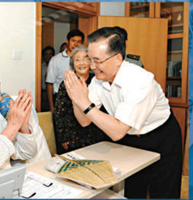
▲國務院總理溫家寶8月6日登門看望錢學森