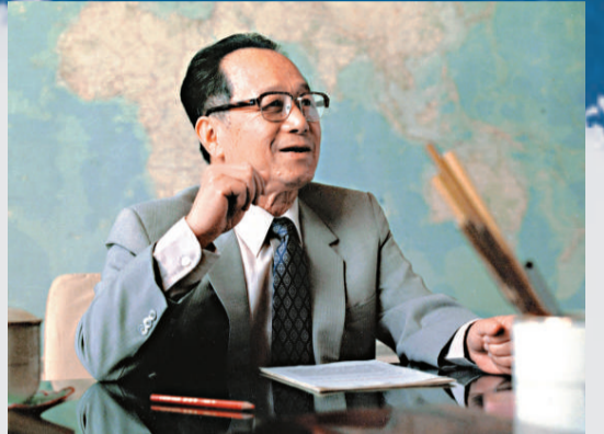
▶谷牧被讚為「中國經濟重臣」

2009年，中國告別了多位學術大師，同樣也告別了多位政壇元老，包括「經濟特區總工程師」谷牧、最後一位開國上將呂正操、鄧小平夫人卓琳、西藏和平解放功臣——阿沛·阿旺晉美等。