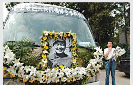
▶鄧小平夫人卓琳女士的遺體告別儀式8月10日在北京八寶山革命公墓舉行

●代表鄧公見證香港回歸者卓琳 7月29日，鄧小平夫人卓琳去世。在十年「文革」動亂中，卓琳陪伴鄧小平在江西度過流放生活，被稱為鄧小平半個世紀的「拐杖」。97香港回歸之際，卓琳代表鄧公赴港出席中英交接儀式，代表「一國兩制」構想的創建者鄧小平，實現其生前「到香港的土上走一走」的願望，見證了香港回歸的盛況。鄧小平女兒鄧榕曾回憶說：「在慶典時，江澤民主席把母親攙扶起來，母親深情地向大家招手致意。她是在代表父親向全體香港人民致意。」