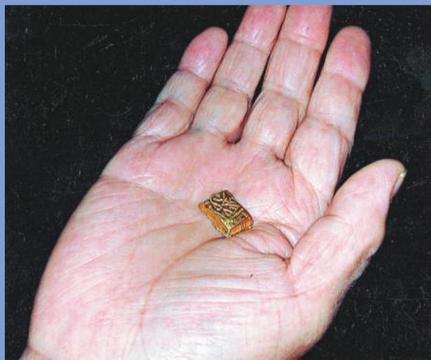
手掌中是楚國金幣 郢爰