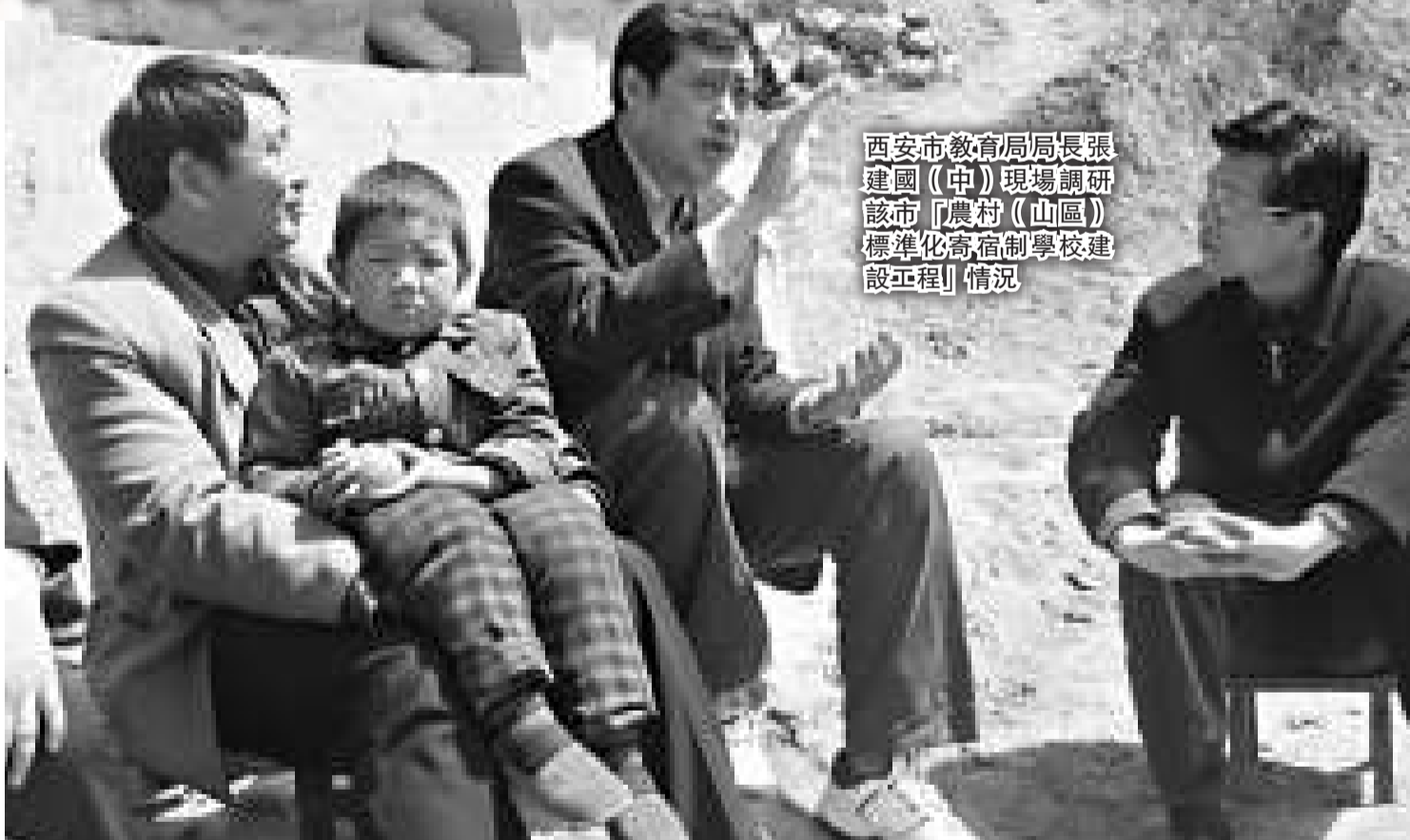
西安市教育局局長張建國（中）現場調研該市「農村（山區）標準化寄宿制學校建設工程」情況

改革開放30年，尤其是西部大開發10年來，隨着各級政府教育投入的不斷加大，城區學校的硬件軟件水平首先得到跨越提升，但西安市轄區的農村地區基礎教育狀況在前幾年依然不容樂觀。