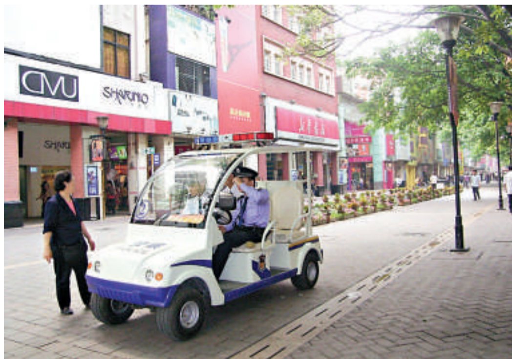
◀廣州亞運安保將投入23億元，確保「平安亞運」

據統計，今年前11個月，廣州刑事案件立案5.5萬宗，同比下降11.6%，預計今年全年刑事案件將在6萬宗以內。