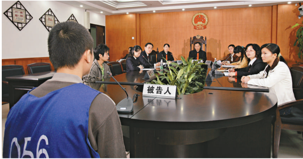
◀近年廣東法院人員違紀違法案凸現，法官涉窩案明顯增多，圖為法院開庭審案現場

廣東省高院黨組副書記、常務副院長陳華傑在昨日召開的全省政法工作電視電話會議上表示，楊賢才案「令廣東法院形象遭受重創，使全省法院隊伍集體蒙羞，在全省法院系統引起極大震動」。至今該窩案僅牽涉省高院、廣州市中院的違規法官人數便達36人次，其中4人因涉嫌犯罪被開除黨籍及公職，並已移交司法機關處理。