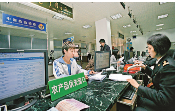
▲海關開闢「綠色通道」和「保鮮通道」辦理農產品通關