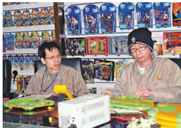
▲以單純做加工貼牌的東莞的港企，希望升轉計劃提高產品競爭力（本報攝）

據悉，對參與基本評估的加工貿易企業，東莞市財政以每家企業5萬元輔導費用為標準，按企業實際支付費用的80%給予資助；對參與深入評估的加工貿易企業，以每家企業10萬元輔導費用為標準，按企業實際支付費用的50%給予資助；對參與轉型升級輔導的企業，市財政按企業實際支付費用的50%給予資助，每個項目最高補助30萬元。