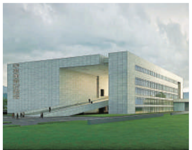
▲辛亥革命紀念館效果圖

籌建方認為，長洲島乃黃埔軍校所在地，擁有東征陣亡烈士墓園、北伐紀念碑、長洲炮台等人文、歷史遺跡和幽靜蔥鬱的自然景觀。在此地建設辛亥革命紀念館，將與黃花崗烈士陵園、廣州起義舊址紀念館等處形成一個展示中國近代革命歷史歷程的建築群，成為廣州市的標誌性建築之一，為各界人士提供一個交流研究中國近代史的重要基地。