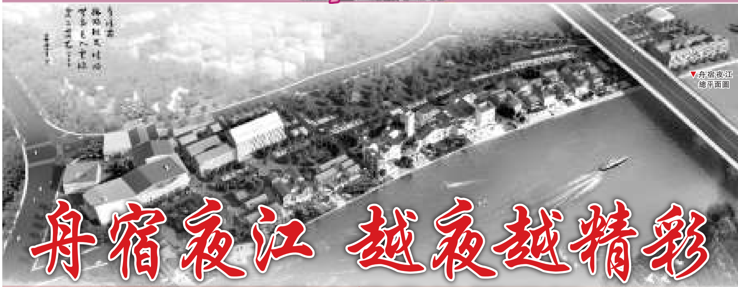
舟宿夜江總平面圖