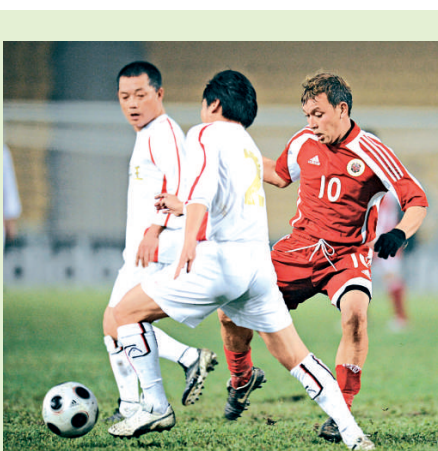
度士（右），奮力追截對手