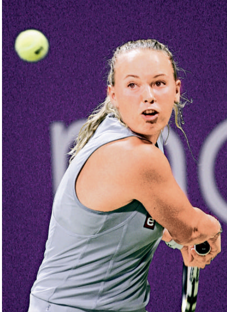
▲19歲的丹麥小將禾施妮雅琪已躍升排名世界第4位，前途無限量

【本報訊】世界排名第4位、將擔任歐洲隊隊長來港參加香港網球精英賽2010的丹麥女子球手禾施妮雅琪表示，對自己今年的成績感到滿意。禾施妮雅琪又稱盼望到香港到處觀光。