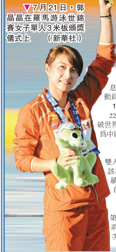
▼7月21日，郭晶晶在羅馬游泳世錦賽女子單人3米板頒獎儀式上（新華社）