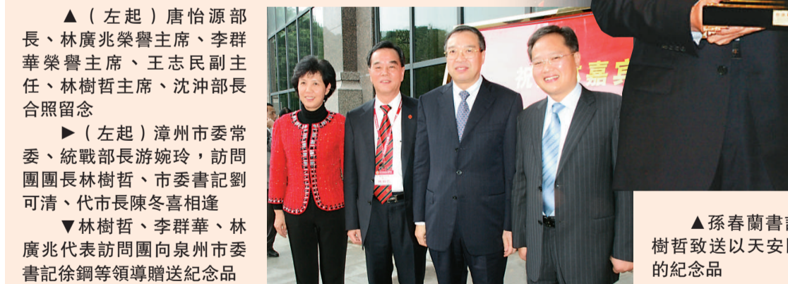
▲(左起)漳州市委常委、統戰部長游婉玲，訪問團團長林樹哲、市委書記劉可清、代市長陳冬喜相逢 ▲林樹哲、李群華、林廣兆代表訪問團向泉州市委書記徐鋼等領導贈送紀念品