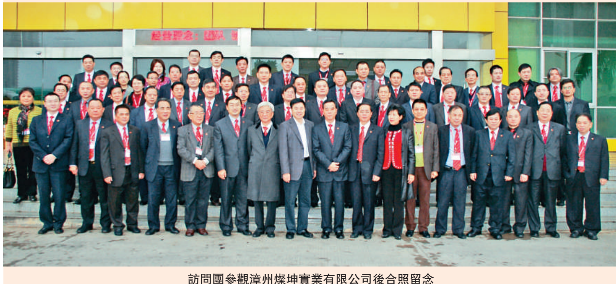
訪問團參觀漳州燦坤實業有限公司後合照留念