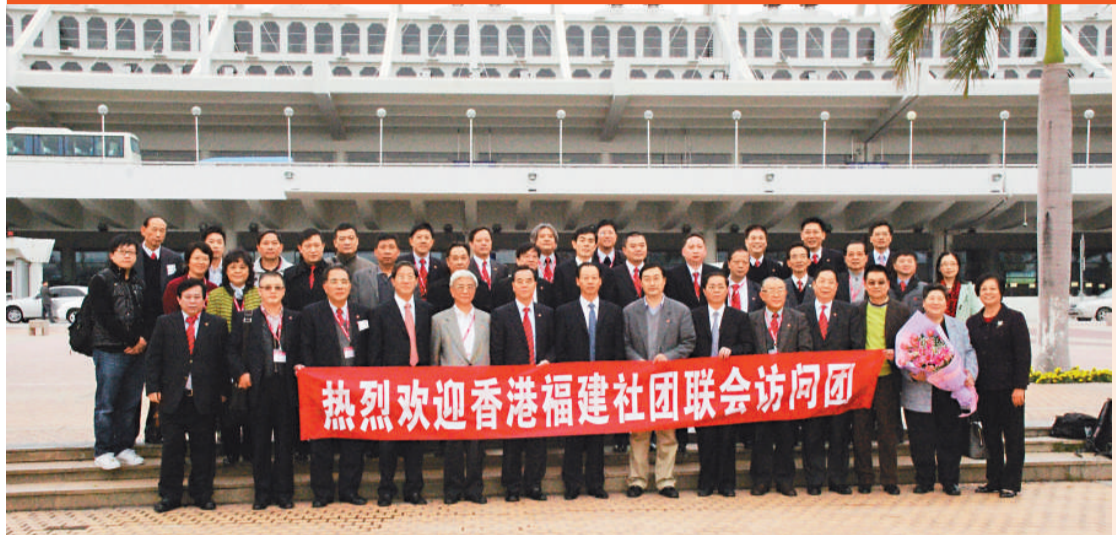
▲香港福建社團聯會訪問團抵達廈門機場，與前來接機的張雙飛部長(前排左七)合照留念

訪問團在四天的緊密行程中，又在各市進行考察和參觀。當中包括：漳州燦坤實業有限公司、角美工業綜合開發區；泉州的中國閩台緣博物館；福州的三坊七巷歷史文化街、又出席假向林書院舉行的閩澳攝影藝術作品展，同賀澳門回歸祖國十周年。訪問團在到訪福建長樂歸國華僑聯合會、參觀冰心文學館，懷緬提倡「愛的教育」的偉大教育家冰心的生平事蹟後，乘機回港，圓滿順利完成四天福建之旅。