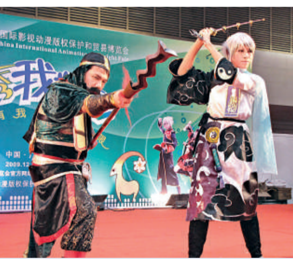
動漫博覽會展廳內的Cosplay表演吸引了衆多市民圍觀

據了解，博覽會期間將舉行影視動漫版權交易、動漫衍生品展銷、Cosplay表演、動漫產業高峰論壇等九大主題活動，另外，國際版權交易中心將組織80到100個原創動漫版權項目在博覽會期間進行發布，並提供從版權確認、價值評估以及項目撮合、合同備案、法律維權等一條龍服務。