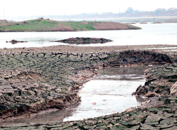
由於亂採濫挖砂石，武漢的河床已遭到嚴重破壞

自三峽截流後，長江砂石資源銳減，砂石資源不足與市場需求旺盛的矛盾十分凸出，禁採管理難度大。尤其是在非法採砂利益鏈中，黑惡勢力滲透，暴力抗法事件時有發生，砂霸的千艘採砂船一度淘空了漢江河道，有些砂霸披着「合法」的外衣，甚至還有政府官員參與其中，給打擊非法採砂帶來阻力。