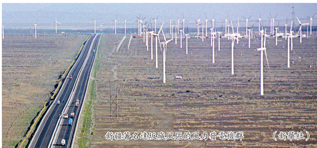
新疆著名達坂城風區風力發電機群