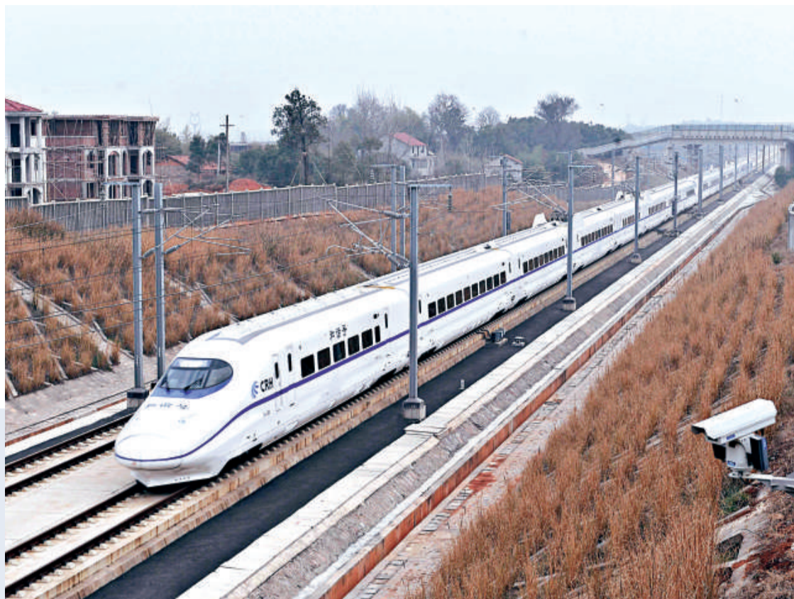
▲武廣高鐵開通僅5日，就接連發生故障，引起民衆的關注