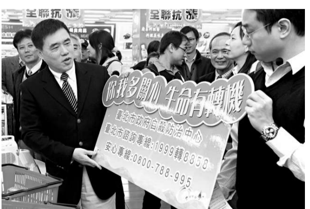
台北市長郝龍斌（左）三十日化身自殺防治守門人，宣導北市府與民間企業合作建立的社會關懷網，勸導可能的自殺行為

其實，在陳水扁時期，他就以個人名義接受政治獻金，進而撥款給候選人來提升支持度；據說蔡英文接手黨主席時，黨內已有上億元的缺口。相較於國民黨內部分裂問題，以及緊急黨產問題，民進黨卻窮得只剩政治。去年尾牙（農曆年底），蔡英文甚至自費十幾萬元辦桌慰勞黨工，而今年，民進黨依舊無法好好過年。