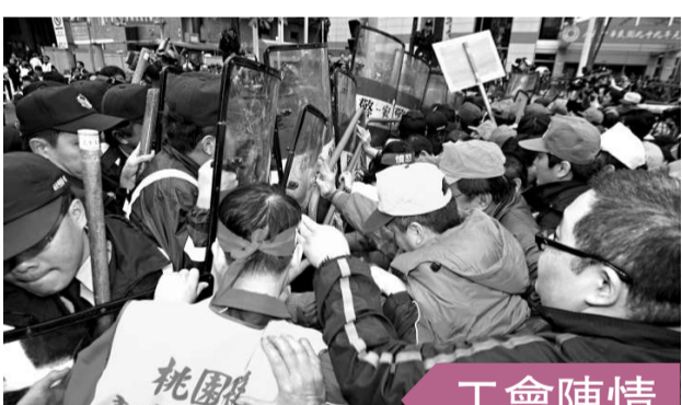
工會陳情，呼籲支持工會版本的工會法修法。陳情最後擦槍走火，爆發肢體衝突。

「法務部」政務次長黃世銘表示，由於廉政指標調查是一個整體的研究案，期間除民調外，還有辦多場座談會，民調作出後還要分析結果，分析後再送回「法務部」審查，因此才在年底公布。